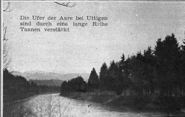
Die Ufer der Aare bei Uttigen sind durch eine lange Reihe Tannen verstärkt

liche Schritte... Er stürzte ins Freie und eilte der fliehenden Gestalt nach.