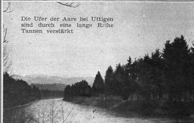
Die Ufer der Aare bei Uttigen sind durch eine lange Reihe Tannen verstärkt

liche Schritte... Er stürzte ins Freie und eilte der fliehenden Gestalt nach.