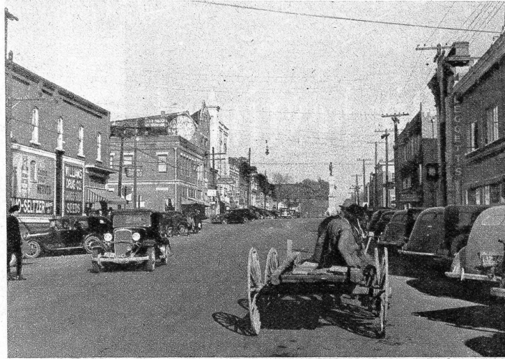
Oxford in Nord-Carolina, wurde im Jahre 1764 von Engländern gegründet. Die Stadt bildet mit ihren 4000 Einwohnern ein wichtiges Handelszentrum inmitten des reichen Tabaklandes und verfügt neben vielen Kaufläden auch über eine Tabakbörse.

Das will nun allerdings nicht heissen, dass die heutigen Bewohner sich nicht als gute Amerikaner fühlen. Vielerorts sind von den einstigen Gründern wenig oder keine Nachkommen mehr anzutreffen. Die Sprache in Handel und Wandel ist und bleibt amerikanisch, auch wenn sich da und dort, wie z. B. in schweizerischen Niederlassungen, der heimatische Dialekt bis auf den heutigen Tag zu erhalten vermochte.