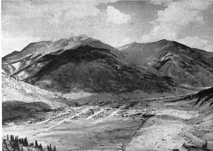
Silverton in Colorado, eine Bergwerksstadt, liegt in einem unwirtlichen Tal des San Juan-Landes, auf 2600 Meter ü. M. und hat 1200 Einwohner. Im Winter ist die Niederlassung während mehrerer Monaten von der Aussenwelt abgeschnitten. Die umliegenden Berge bergen grosse Lager an Silber, Gold, Kupfer und Zink in sich.