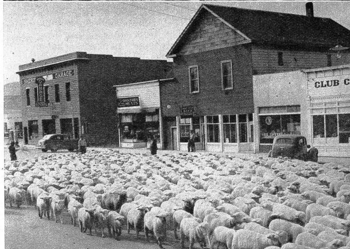
Sheridan, im Staate Montana, liegt auf 1500 Meter Meereshöhe im Rudi-Tal und zählt 100 Einwohner. In seiner Nähe befinden sich mehrere Silber- und Goldminen, und die landwirtschaftliche Bevölkerung widmet sich zur Hauptsache dem Ackerbau und der Schafzucht. Sheridan taufte sich nach General Philip H. Sheridan, einem Helden der amerikanischen Armee.