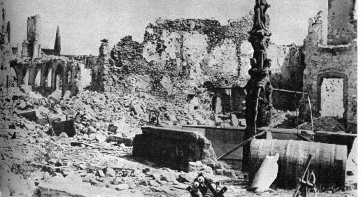
Drei Jahre sind es her, seitdem die Artillerie dieses französische Dorf vernichtet hatte. Hier gibt es buchstäblich nichts mehr aufzubauen, und selbst heute noch ist alles immer noch vermint und kein Mensch wagt sich in diese Trümmer