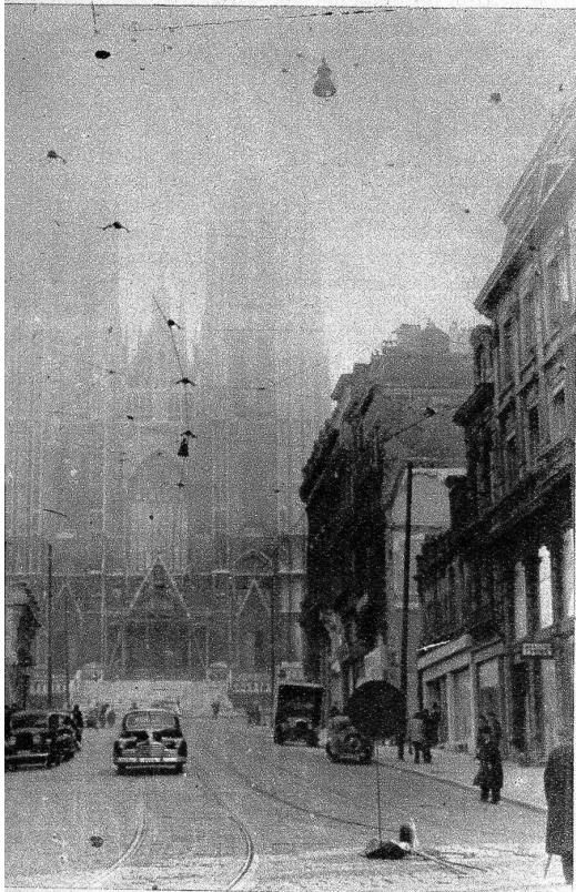
Brüssels Kathedrale verschwindet im Morgennebel

Der Krieg ist vorbei, gewiss, aber Frankreich erholt sich nur langsam, und die Not ist fühlbar. Kein Mensch spricht darüber, und wer weise ist, fängt auch nicht an, darüber