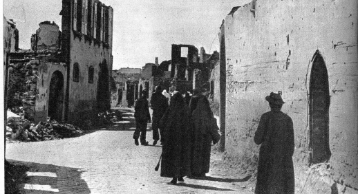
Die Statistik vermag genau zu erfassen, wieviele Wohnstätten noch immer zerstört liegen — keine Statistik aber vermag je zu erfassen, wieviel zerstörte Zukunft in diesen Ruinedörfern Frankreichs noch wohnen muss

Wer keine guten Gründe hat, mitten im Winter mit einem Automobil über die Landstrassen der nordeuropäischen Länder zu fahren, der lasse es in seinem eigenen Interesse bleiben, denn ein Vergnügen ist es so oder so nicht. Wer keine guten Gründe hat, sich nach Nordeuropa zu begeben, der lasse es lieber bleiben, denn das Beschaffen der Visa ist keine einfache Sache und setzt stichfesteste Erklärungen und Gründe voraus. Und sind diese Visa beschafft, dann setze man sich erst einmal mit den betreffenden Stellen auseinander, man erkundige sich genau, wie es mit den Devisen stehe, wieviel man mitnehmen dürfe und wieviel man zu belegenden Kursen im Ausland offiziell einzuwechseln habe. So kann man zum voraus schon den Verlust berechnen, denn jedes offizielle Wechseln im Ausland ist heute, bei den herrschenden hohen Preisen, ein reines Verlustgeschäft. Will man