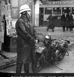
Belgische Verkehrspolizei regelt und überwacht nicht nur den Verkehr, sondern hat auch ein gutes Auge für gestohlene Jeeps etc.