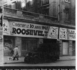
Kaum eine westeuropäische Stadt, in der es heute nicht eine Churchill- oder Rooseveltstrasse, Tanzhalle, Kino, Park oder dergleichen gibt. Europas grösstes Variété ist soeben in Brüssel unter dem Namen Roosevelt eröffnet worden

oder durch Frankreich, Luxemburg, Belgien. Und für alle diese Länder benötigt der Schweizer ein Visum, sei es nun ein einfaches Transit — sei es ein Aufenthaltsvisum. Der Franzose zum Beispiel braucht diese Visa nicht, so wenig wie der Belgier, Luxemburger oder Holländer, denn diese vier Staaten sind zum Schluss gekommen, dass der Krieg vorbei sei und dass man diesen Visumhaber ruhig beschaffen dürfe. Diese Erkenntnis hat in diesen vier Ländern Gültigkeit, in die Schweiz jedoch ist sie noch nicht gelangt, da wir uns gewöhnen sehen, unsere Grenzen hermetisch zu verriegeln und jeden Reisenden durch den Visumszwang abzuschecken. Diese Kontrolle ist so lückenhaft, dass es keinem einzigen internationalen Hochstapler mehr gelingt, in die Schweiz zu kommen. Kein einziger Schmuggler und kein einziger Falschgedopassier findet so mehr den Weg in die Schweiz — nein, diese Leute sind wir auf ewige Zeiten hinaus los, und wenn wir unsere Leib- und Tagesblätter aufschlagen finden wir unter den Verbrechen nur noch