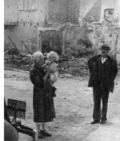
Nichts ist diesen Menschen geblieben — wenn man so will: Doch das Leben und die Hoffnung haben sie behalten, die Hoffnung, dass der seit vier Jahren vermisste Sohn doch noch heimkomme