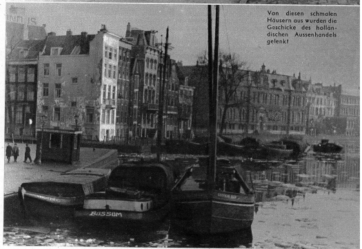
Van diesen schmalen Hausen aus wurden die Geschichte der holländischen Aussenhandels gebildet

sterdam, die Häuser in Uniform und oftmals so Spielzeug extensiv und tatsächlich kann man Frauen sehen, die die Hausfassaden mit Schrupper und Wasser bearbeiten, von den Trottoirs nicht zu sprechen. Ein Drehorgelmann dudelt trotz der Dunkelheit noch immer umher und seine Orgel ist so gross wie zwei alte Zürcher-Weltenschänke auf Rädern. Amsterdam muss ebenfalls Licht sparen und schon um sieben Uhr abends ist diese grosse und von allen andern Städten des Kontinents so verschiedene Stadt ziemlich dunkel. Die fast überall halbkreisförmig verlaufenden Strassenzüge machen die Orientierung nicht leichter. Ein Drahtglockenlichter glänzen grün und rot, Verkehrszeichen ohne Beleuchtung erheischen Vorsicht und ein sehr strenger Fahr- und Fussgängerverkehr beweist, dass Amsterdam nicht schläft. Finstere Kanäle, dunkle Häuser, kahle Bäume. Der Regen fällt über Amsterdam und die Nebel drücken von der Amstel her. Sehr freundliche Verkehrspolizisten warnen Sünder und informieren den Stadtkundigen in Knappen, aber sehr präzisen Winken. Wie gesagt, es ist nicht leicht, sich in Amsterdam zurecht zu finden. Dass ich schliesslich das Amstel-Hotel doch noch finde, verdanke ich tatsächlich weniger meiner eigenen Findigkeit