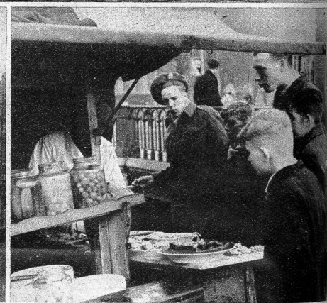
Auf der Strasse werden Heringe verkauft: Man schwenkt den Fisch in einer Sauce herum und führt ihn mit 2 Fingern zum Mund. «E Gue!»

Gestalten, denen man selbst bei Tageslicht nicht gerne begegnet, stehen verloren an den Ecken oder in engen Türeingängen. Aus den Fenstern fliegt Unrat in die Kanäle, Christbäume kommen aus Fenstern des vierten Stockwerkes und leere Flaschen kommen irgendwoher aus der Höhe. Eine gefährliche, aber interessante Gegend.