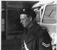
Holländischer Militärpolizist an der belgisch-holländischen Grenze, ein Mann, der seine Pflichten sehr genau nimmt

Ich will an diesem Abend Amsterdam erreichen und halte mich nicht auf. Zeitweise bricht die Sonne für einige Minuten durch, beleuchtet das wellige Land und die sauberen Gehöfte, die sauberen Dörfer, Löwen, mit seinem prachtvollen Rathaus, Malines (Mecheln) sind auf den schönen Strassen sehr schnell erreicht und passiert. Antwerpen, die Königin des belgischen Aussenhandels, wird auf der Durchfahrt ebenfalls nur gestreift, und übrige wird in Antwerpen gestreift, und es wird geschossen und geräut, beim hellen Tageslicht, man verpasst nichts, wenn man sich an die breiten Durchgangsstrassen, die beim Scheiteltunnel vorbeiführen, hält. Zur Abwechslung kommt wieder eine schnurstrahle Chaussee, von hohen Ulmen umsäumt. An den Blumen hängen noch die Vormarschwegweiser der alliierten Offensive gegen