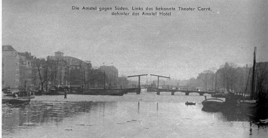
Die Amstel gegen Süden. Links das bekannte Theater Carré, dahinter das Amstel Hotel