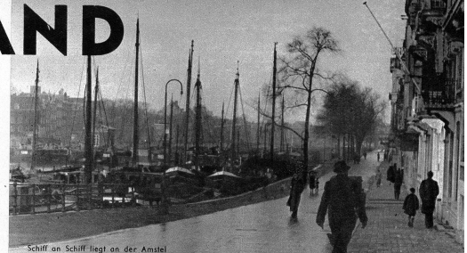
Schiff an Schiff liegt an der Amstel

Holland, das im allgemeinen nur bis 12 Meere über Meer und von dem grosse Teile unter dem Meeresspiegel liegen, hat ein dementsprechendes Klima, und ich bekam schon in den ersten Stunden einen Versuch von holländischen Nebel, der sich blitzschnell über das ganze Land zog. Nur gut, dass die Autobahn von Rotterdam nach Amsterdam ein Bahn auf zwei Bahnen ohne Gegenverkehr gestattet, denn bei diesem Nebel, der eine Sicht von kaum 10 Metern erlaubte, war das Spritzen keine reine Freude mehr. Feiner Niesel regnete auf den Strassen, die über die Kanäle führen, kommen diese schönen Strassen zusammen - eine gefährliche Angelegenheit, die jeden Tag Unglücke herbeiführt. In Reich und Glied präsentiert sich Am-