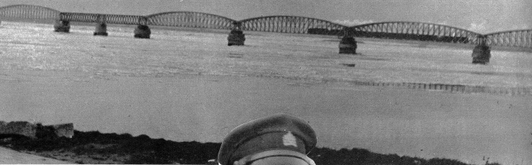
Über diese Brücke - Holländische Diep zwischen Breda und Rotterdam - fährt toeben der Express Basel-Amsterdam

Ich will an diesem Abend Amsterdam erreichen und halte mich nicht auf. Zeitweise bricht die Sonne für einige Minuten durch, beleuchtet das wellige Land und die sauberen Gehöfte, die sauberen Dörfer, Löwen, mit seinem prachtvollen Rathaus, Malines (Mecheln) sind auf den schönen Strassen sehr schnell erreicht und passiert. Antwerpen, die Königin des belgischen Aussenhandels, wird auf der Durchfahrt ebenfalls nur gestreift, und übrige wird in Antwerpen gestreift, und es wird geschossen und geräut, beim hellen Tageslicht, man verpasst nichts, wenn man sich an die breiten Durchgangsstrassen, die beim Scheiteltunnel vorbeiführen, hält. Zur Abwechslung kommt wieder eine schnurstrahle Chaussee, von hohen Ulmen umsäumt. An den Blumen hängen noch die Vormarschwegweiser der alliierten Offensive gegen