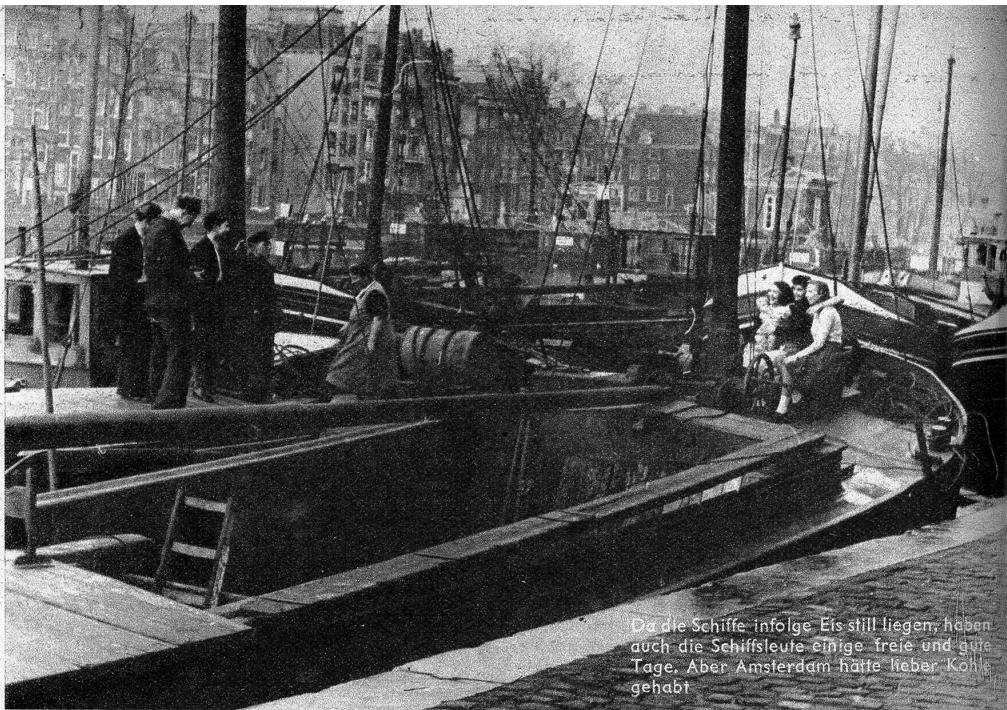
Da die Schiffe infolge Eis still liegen, haben auch die Schiffsleute einige freie und gute Tage. Aber Amsterdam hätte lieber Kohle gehabt

Die Gegend zwischen Rembrandts Plein, Dam, Damrak, Schreierstoren, Montelbs Toren umschliesst das alte, düstere Amsterdam, mit seinem ehemaligen Ghetto bei der Joden Bree Straat, mit dem Nieuwen Markt und seinem massiven Turm, mit den kleinen Gassen, mit den kleinen Cafés, in denen nur Malayen, Chinesen, Mischlinge und Schauerleute aller Farben verkehren. Auch wenn man eine von Natur aus tapfere Seele besitzt, ist es ratsamer, nach Einbruch der Nacht nicht allein in dieser Gegend Luft zu schnappen. Die Strassen längs der Kanäle sind so schmal, so glitschig, und man liegt so schnell im Wasser, und niemand wird einmal sagen können, dass es nicht ein Unfall gewesen sei.