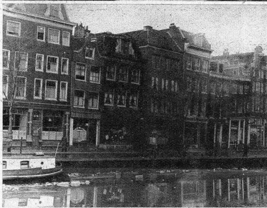
Ein Haus muss das andere stützen, in Amsterdams Altstadt