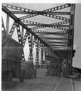
Da diese Strassenbrücke über den holländischen Diep noch in Reparatur ist, wird der sehr strenge Verkehr einseitig abwechselnd geführt. Oft muss man eine Viertelstunde warten