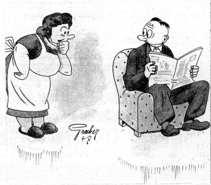
«Hesch au e Wunsch zum Geburtstag, Heiri?» — «Jo, allerdings — aber der Friedensrichter het gseit, i müess e triftige Grund chönne gä.»