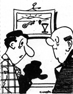
«Streitet ihr euch nie, du und deine Frau?» — «Nein!» — «Komisch, wie kommt das?» — «Ich habe keine Frau...»