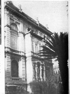
Rechts: Teil der imposanten Fassade