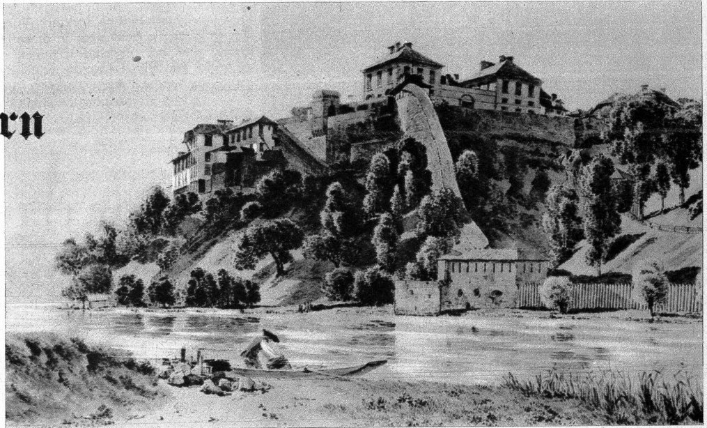
Die Münze, 1793. (Aquarell von J. J. Biedermann)

Der Turm fiel im 17. Jahrhundert dem Zerfall anheim, und deshalb ist er auch als «zerfallene Turm» bezeichnet worden. Die Räte berieten über geeignetere Flußsperrn mittels Ketten (sic!) und andere möglichen und unmöglichen Dinge. Im Jahre 1688 erhielt der Stadtmajor Frisching den Befehl «zur neuen Beschussung der Stadt, schräg, flangwies an der Aare eine Mauer zu errichten», das will heissen, eine den Torturm flankierende Mauerblende oder Flußsperr. Und gerade jene «schräg flang-