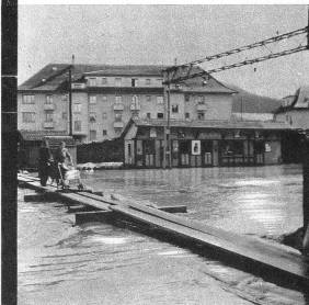
Von den Geleisanlagen bei der Station Liebefeld war keine Spur mehr zu sehen