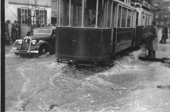
Die Ueberschwemmung des Sulgenbaches an der Brunnamtstrasse in Bern. - Strassenbahn und Autos suchen sich vorsichtig einen Weg durch die Fluten der Brunnamtstrasse