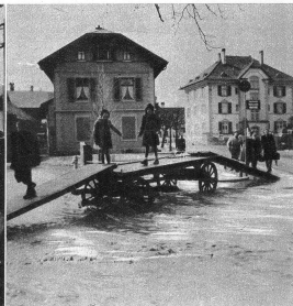
Notsteg über den reissenden «Hauptstrass-Fluss» in Köniz-Dorf