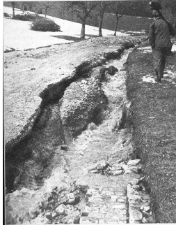
Das Strässchen Neuenegg-Brüggelbach wurde stellenweise fast vollständig weggerissen