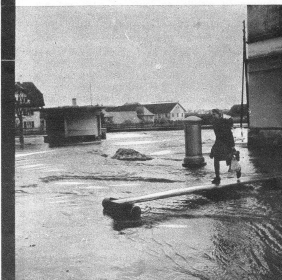
Der vollständig überschwemmte Neuhauptplatz im Liebefeld. Das «Fadenspüli», die Omnibushaltestelle, ragt hinaus aus den Fluten