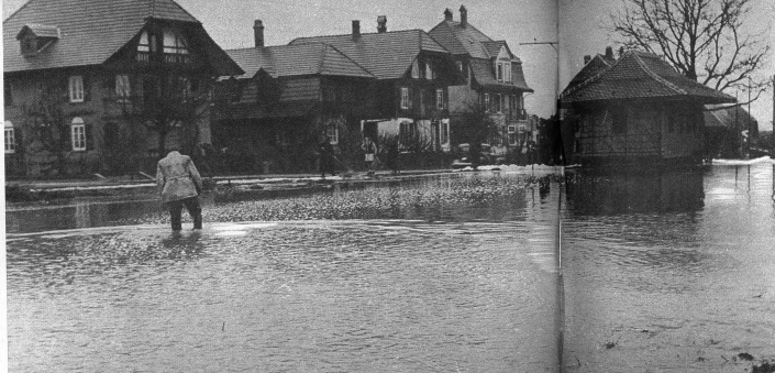
Die trüben Fluten, die von Zollikofen her über das sog. Seedorf und die Hauptstrasse entliefen, überschwemmten in Moosseedorf den Stationsplatz bis zu einem halben Meter tief