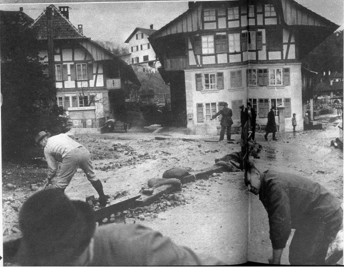
Die Wasserwehr bei der Kirche Neuenegg. Unter dem Hochwasser liess besonders die Strasse, die auf weite Strecken aufgerissen wurde...