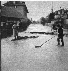
Hier, an der Brunnamtstrasse, liegt irgendwo die Tramschiene verborgen