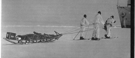
Rechts: Während das Flaggschiff «Mount Olympus» durch Packeis gezwungen war, für einige Tage liegen zu bleiben, machte sich die Besatzung zur Seehundsgagd auf. Wir sehen hier vier Mann, einen 500pfündigen Seehund nach sich ziehend, zum Schiff zurückkehren.