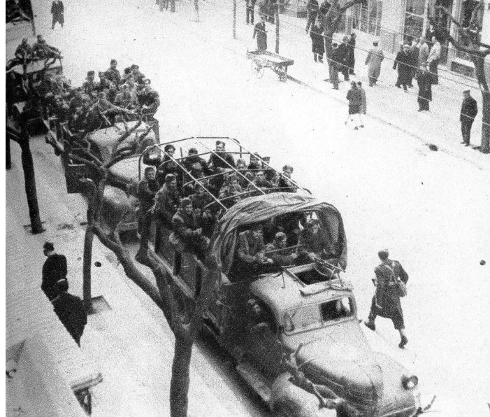
Nach dem Hilfsversprechen Trumans gegenüber der griechischen Regierung dürften die Tage der räuberischen Guerillas an der Nordgrenze Griechenlands gezählt sein. Die zugesicherte amerikanische Hilfe scheint das Rückgrat der Regierung bereits beträchtlich gestärkt zu haben. — Unser Bild zeigt griechische Regierungstruppen auf ihrer Fahrt ins Kampfgebiet in Thessalonika.