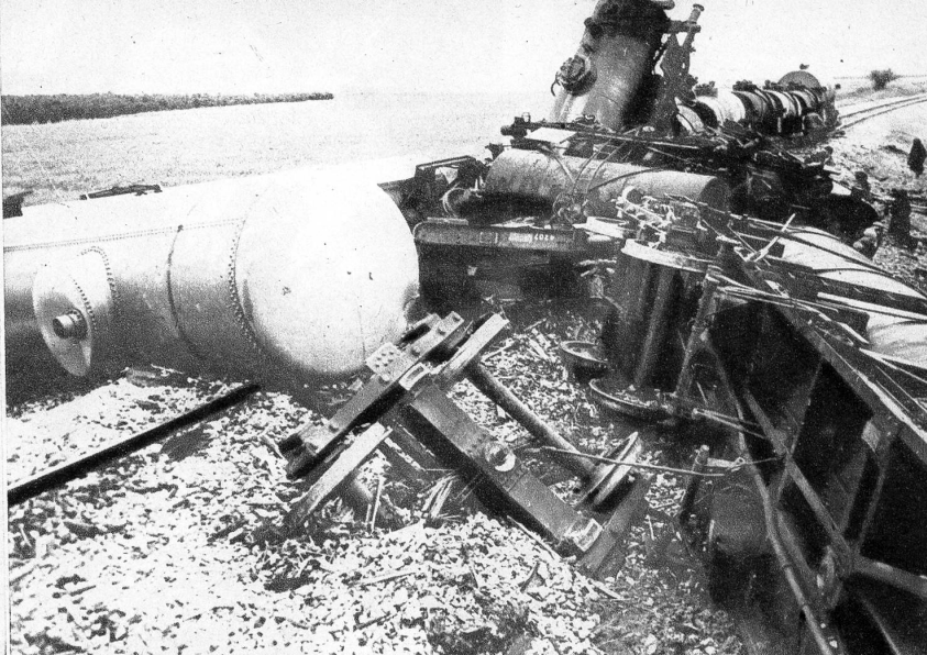
Zwischen Tel Aviv und Haifa, also in der Zone, in welcher das Standrecht verhängt ist, haben jüdische Terroristen verschiedene Eisenbahnattentate unternommen. Bei Petah Tikwah wurde ein Zug mit Erdöl in die Luft gesprengt. Die Angreifer versuchten, das Oel in Brand zu setzen, was aber verhindert werden konnte. Von den nahen Dörfern kamen Araber, Frauen und Männer, herbei und füllten ihre Bidons mit der ausgelaufenen kostbaren Flüssigkeit.

rieren zwischen Ost und West und auch zwischen der anglo-amerikanischen und der französischen Zone weiterbestehen. Es war denn auch der amerikanische Aussenminister General Marshall , der Molotow sofort entgegenhielt, der Schlüssel zur Lösung des deutschen Problems sei die «Behandlung des Reiches als wirtschaftliche Einheit». Die einheimischen Wirtschaftsquellen müssten gemeinsam benutzt werden. Ein Export- und Importplan müsse ebenso aufgestellt werden wie die endgültige Reparationenrechnung. Freizügigkeit für die Wirtschaft, zentrale deutsche Verwaltungsstellen, eine Reform der Finanzen seien unerlässlich, und allem voran müssten die Zonengrenzen fallen.