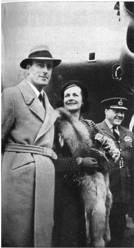
Lord Louis Mountbatten, der neue und letzte Vizekönig von Indien, ist dieser Tage vom Londoner Flugplatz Northolt aus im Flugzeug nach Indien abgereist, wo er den Rückzug der britischen Truppen vorzubereiten hat. U. B. zeigt Lord Mountbatten und Gattin vor dem Flugzeug beim Abschied