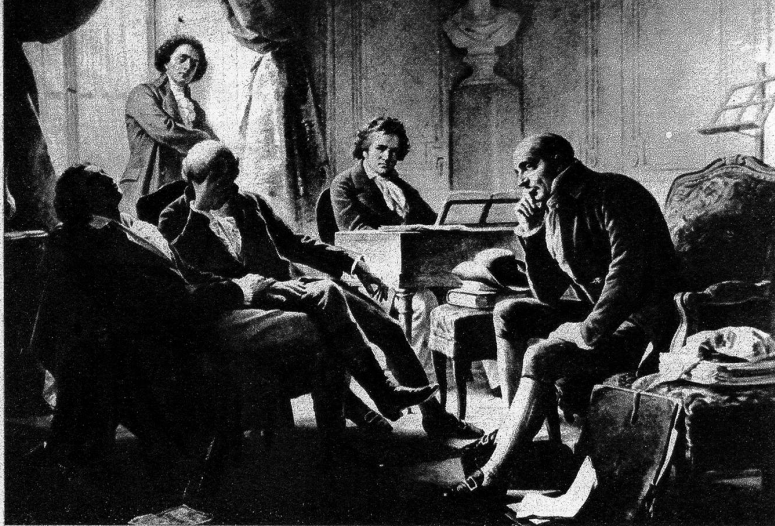
Beethoven im Kreis seiner Freunde Gemälde von A. Gräffe