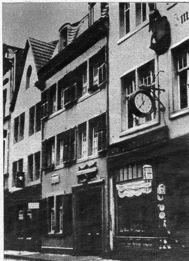
Strassenansicht von Beethovens Geburtshaus in Bonn, das als Beethoven-Museum eingerichtet wurde

Holland und als 11- und 12jähriger gibt er bereits die ersten Klaviervariationen heraus. Die letzten Unterrichtsweihen soll der begabte Knabe beim grössten lebenden Meister, bei Mozart, erhalten und 1787 reist er mit Unterstützung des kurkölnischen Hofes nach Wien, muss aber wegen der Mutter Tod sein Studium unterbrechen und kann erst 1792 wieder nach Wien zurückkehren. Nun ist aber nicht mehr Mozart, sondern Josef Haydn sein Lehrmeister. Dann erwirbt sich Beethoven als Klavierspieler grossen Ruf, hinzu aber steht er binnen weniger Jahre in der ersten Reihe der schaffenden Musiker, und im März 1795 ist der Meister als Spieler eines eigenen Klavierkonzertes in Wien öffentlich aufgetreten. Nun beginnen Konzertreisen durch