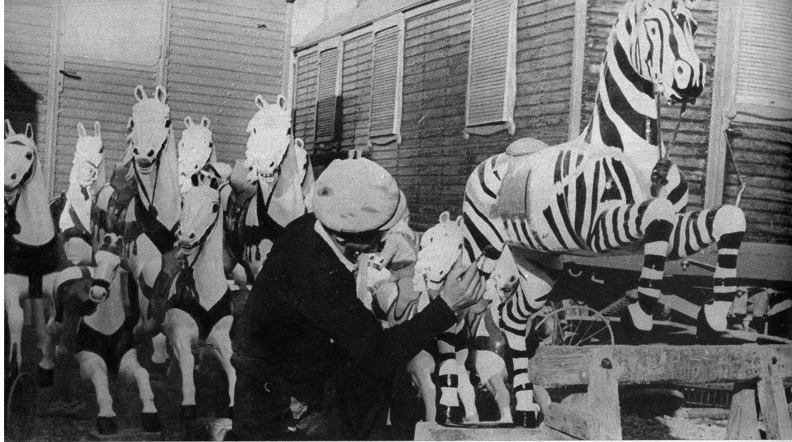
Die Pferde und Zebras vom Karussell erhalten einen neuen, verlockenden Anstrich, damit die Kinder mit besonderer Freude auf ihnen «reiten» werden.