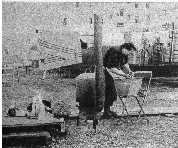
Wie so vieles, so müssen die Frauen des «fahrenden Volkes» auch auf die Vorzüge einer modern eingerichteten Waschküche verzichten. Aber was tut es, man ist strenges Arbeiten gewöhnt und die Wäsche wird auch auf diese althergebrachte Weise sauber.