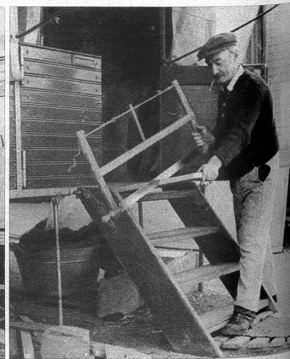
Obschon es eine tote Zeit ist, gibt es nicht minder zu arbeiten. Ueberall findet man etwas auszubessern oder neu zu erstellen, und dann erweist sich der Artist und Budenbesitzer auch noch als geschickter Handwerker.