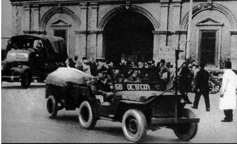
Die durch die Labour-Regierung versprochene Räumung Aegyptens durch die englischen Truppen ist Tatsache geworden. Die letzte Einheit hat die Kasr-el-Nil-Kaserne in Kairo verlassen, wo König Faruk eigenhändig die ägyptische Flagge hisste. — Unser Bild hält den historischen Augenblick des Auszugs der letzten britischen Einheit aus Kairo fest.