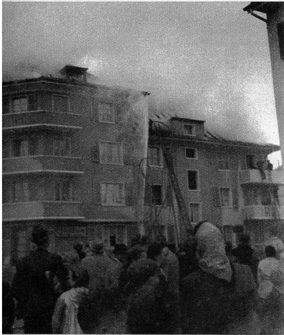
Am Mittwoch der vergangenen Woche brach im Estrich eines Mehrfamilienhauses in Wabersacker bei Köniz Feuer aus, dem der ganze Dachstock des Hauses zum Opfer fiel. Nach zwei Stunden konnte der Brand durch die Feuerwehr gemeistert werden, doch entstand durch das Wasser erheblicher Schaden im ganzen Hause