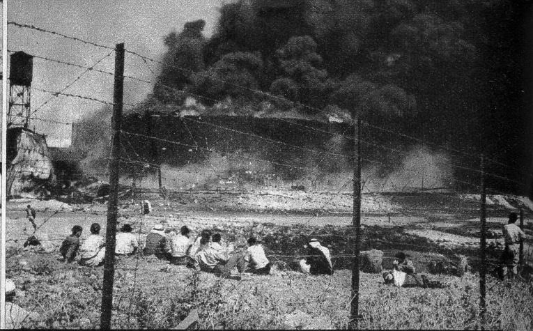
Terroristen der Sternbande haben in Haifa (Palästina) die grossen Oeltanks, die das Ende der Pipeline aus dem Irak bilden, in Brand gesteckt. Der Schaden beträgt an die 100 Millionen Schweizerfranken! Unser Bild zeigt einen der rauchenden Oeltanks. Stundenlang blieb der Hafen von Haifa in dunkle Rauchwolken gehüllt.