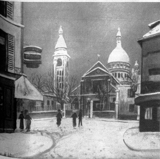
«Saint Pierre de Montmartre et le Sacré-Cœur», von Maurice Utrillo, geb. 1883