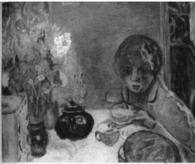
«Le petit Déjeuner», von Pierre Bonnard, 1867—1947