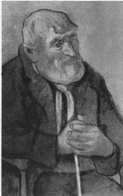
«Le vieillard au bâton», von Paul Gauguin, 1848—1903