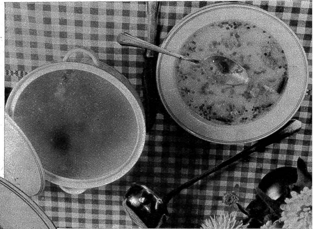
Die wärmende Suppe mit viel feingewiegtem Schnittlauch!