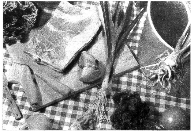
Hier die Zutaten: Es guets Möckli Fleisch, Köhl, Sellerie, Peterli, Tomaten, Zwiebeln, Rüebli, Lauch

Will man eine gute Suppe, dann gibt man das Fleisch in kaltes Wasser; möchte man aber ein saftiges Stücklein Fleisch, wird dasselbe in das heisse Wasser gelegt. Die Suppe wird erst nach der halben Kochzeit gesalzen. Das Gemüse wird gerüstet und wenn immer möglich ganz in die Brühe gelegt. So kann man nachher eine hübsche Platte richten. Die Tomaten werden erst 10 Minuten vor