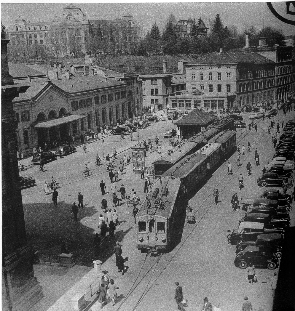
Der Bahnhofplatz, wie er sich heute, von oben gesehen, dem Auge zeigt

Die schlimmste Belastung brachte dem Bahnhofplatz und dem Bollwerk freilich erst die Einführung der elektrischen Bahn Solothurn—Zollikofen—Bern ins Innere der Bundesstadt. Für den