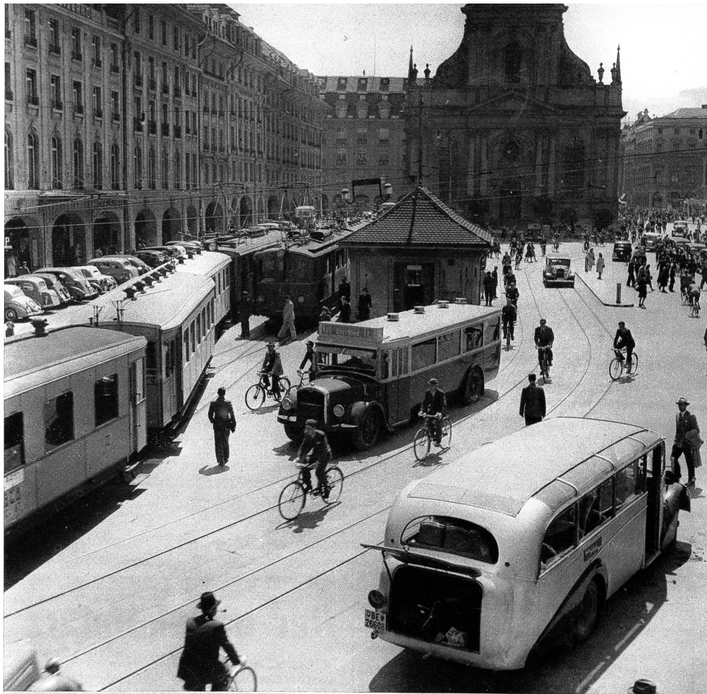
So sieht es in Stosszeiten am Bahnhofplatz aus. Das Bähnli der Solothurn-Zollikofen-Bernbahn, verschiedene Postautos und andere Fahrzeuge versperren zeitweise die Strasse, so dass ein normaler Verkehr unmöglich wird

Das Projekt des Gemeinderates hat an der Stadtratsverhandlung vom 17. April keine Gnade gefunden und ist an seine Verfasser zurückgewiesen worden. Diese Stellungnahme des Rates hat ihre wichtigste Ursache freilich im Bestreben, von der SZB einen grösseren Beitrag an die Kosten des Platzumbaus zu erlangen, als ihn der Gemeinderat in Aussicht stellte. Aber sie gibt den beteiligten Instanzen doch auch die vielleicht nicht ganz unerwünschte Gelegenheit, etliche Einzelheiten ihres Projektes nochmals zu überarbeiten. Zwar ist, wie schon gesagt, der Fahrverkehr in dieser Vorlage ausgezeichnet geordnet; ungelöst scheint jedoch die nicht minder wichtige Aufgabe, auch den Fussgängerverkehr befriedigend zu gestalten und dem Publikum zu diesem Zwecke kurze, übersichtliche und sichere «Fur-