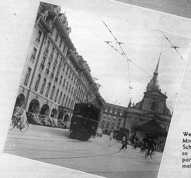
Wenn das Bähnli mit seinem Motorwagen vor dem Hotel Schweizerhof manövriert, so bleibt neben den dort parkierenden Autos nicht mehr viel Platz für andere Fahrzeuge