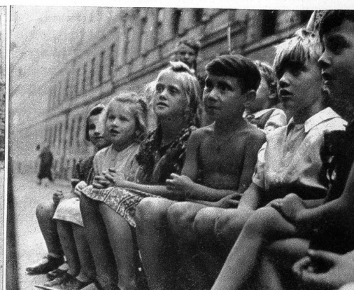
Und dann öffnet sich der Vorhang und für die Kleinen öffnet sich eine andere Welt und lässt sie ihr eigenes Elend vergessen