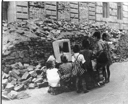
In einer Strasse, die noch zum grössten Teil zerstört ist, steht das „Theater der Kleinen“. Als Sitzplätze nimmt man Backsteine

So zeigt die Bilderfolge eine Wienerfamilie. Der Tag ist gekommen, wo die Kleinen mit der Mama das Kasperltheater anschauen dürfen. Welch eine Freude herrscht unter den Kleinen. Sie vergessen ganz, dass das Frühstück sehr karg ist. Ein wenig mit Wasser verdünnte Milch, einige Gramm Brot und eine etwas zweifelhafte Marmelade. Doch die Hauptsache ist: heute ist ein grosser Tag, man geht ins Kasperltheater.