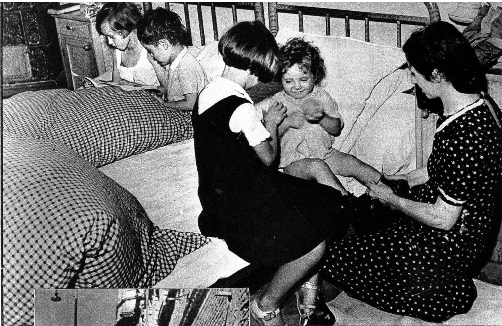
Heute ist ein grosser Tag für die Kinder der Wiener Familie Sch. Die Kinder dürfen zum Kasperltheater. Schnell werden die Kleinen angekleidet, was immer einen Haufen Arbeit ergibt ...