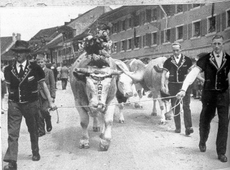
Einer der Währschafftesten des Umzugs, ein prachtvoller Muni