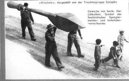
Gewerbe von heute. Der Lohkolben, Symbol des Seeländischen Spanglermeister- und Installateurverbandes