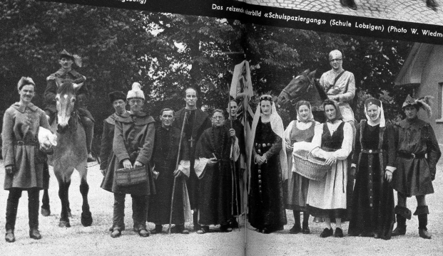
Leute vom Kloster Friesenberg; zirka 1270 (Turnvereine Dönnelriege Seedorf)