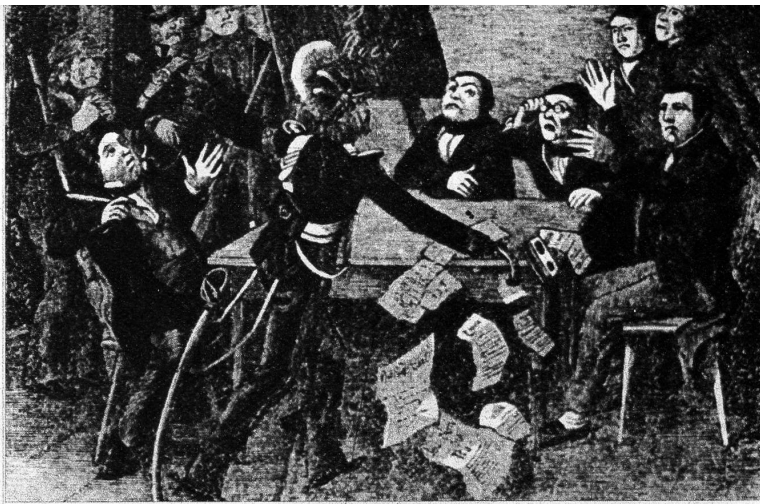
Im Jahre 1856 wurden die royalistischen Gesellschaftshäuser geschlossen, die verdächtigen Royalisten abgefa-

Der Bundesrat versäumte auch nicht für allfällige ernstere Ereignisse die nötigen militärischen Vorbereitungen zu treffen. Denn wie gross die Empfindlichkeit der Diplomatie ist, wenn ihr Wille nicht sofort erfüllt wird, zeigte Preussen, das durch die Note vom 16. Dezember 1856 die Beziehungen mit der Schweiz als abgebrochen erklärte. Preussen glaubte durch diesen diplomatischen Bruch die Schweiz einzuschüchtern, aber umsonst. Die Schweiz mobilisierte und stellte das Heer unter den Oberbefehl von General Dufour. Preussen wagte doch nicht eine militärische Aktion zu ergreifen, so dass der Ausgang des verhängnisvollen Kampfes zwischen Republik und Monarchie im Kanton Neuenburg im Mai 1857 zugunsten der Schweiz ausfiel.