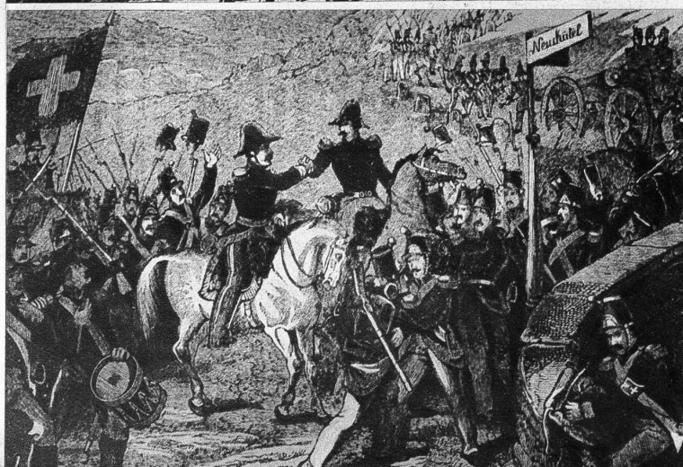
Die Vereinigung der republikanischen Kolonnen Oberst Denzlers mit Major Girards Truppe und Marsch nach Peseux und Neuchâtel