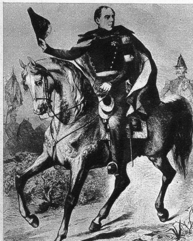
General Dufour, der von der Bundesversammlung zum General ernannt wurde

zu einem grossen Bund gegen Frankreich vereinigt; die Seele dieses Bundes war der grosse Oranier, welcher als Wilhelm III. den englischen Thron bestieg. Die Prätendenten, welche ausser Friedrich I. von Preussen am meisten Aussicht auf Erfolg hatten, waren sämtliche französische Grosse katholischer Konfession. Wäre einer dieser Prätendenten in den Besitz von Neuenburg gekommen, so wäre dieses Fürstentum französisch geworden. Die protestantischen und streng religiösen Neuenburger fürchteten den katholisierenden Einfluss Frankreichs. Denn nicht lange vorher hatte Ludwig XIV. das Edikt von Nantes aufge-