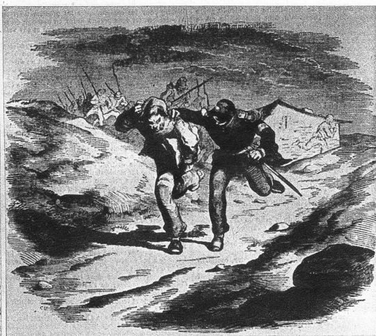
Royalistische Agenten werden verfolgt und gefangengenommen