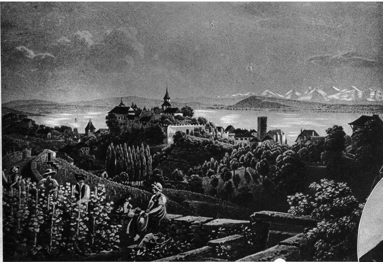
Schloss Neuenburg nach einem alten Stich

Unten: Oberst von Pourtalès, der militärische Befehlshaber der Royalisten, die Anno 1856 zu Neuenburg den Aufstand gegen die Republikaner inszenierten