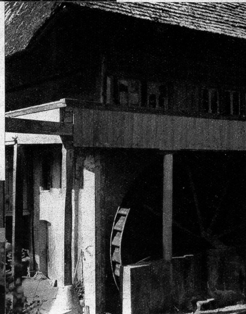
Ein zirka 40 Meter langer Holzkanal leitet das dem Dorfbach entnommene Wasser über die Laube auf der westlichen Seite des Gebäudes

Wagenschmiere gewonnen werden konnte, die bei den Bauern guten Absatz fand. Wuchtige, eiserne Hämmer zermalmten Knochen zu Mehl. Das so gewonnene Knochenmehl war von den Bauern ebenfalls sehr begehrt. Ein besonderer Blickfang für Ausflügler und Passanten bietet das mächtige, einen Durchmesser von sechs Metern aufweisende Mühlenrad. Dieses wurde 1926 vom fachkundigen Zimmermeister Ramser in Schnottwil aus Föhrenholz neu erstellt. Ein Holzkanal von zirka 40 Meter Länge leitet das kraftpendende Wasser vom Dorfbach her in die Schaufeln des Mühlenrades, das noch heute den schweren Kollergang im Kreise dreht, um Körner zu feinem Futtermehl zu verwand-