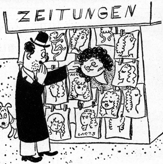
„O! Entschuldigung, ich glaubte, es sei eine Zeitung“

Senkrecht: 1 Ton. 3 Weibl. Sagengestalt (griech.). 4 Kantonsname. 5 Zahl. 6 Gewürz. 9 Süd. Oelfruchtpflanze. 11 Haustier. 14 Engl. Dogge. 15 Landenge. 16 Nachtschmetterling. 20 Scharf hell. 21 Nord. Meergott. 25 Kot des Wildes (weidm.). 26 Nordländer. 28 Ausld. Stadt. 29 Papiermass. 31 Gesetzlich.