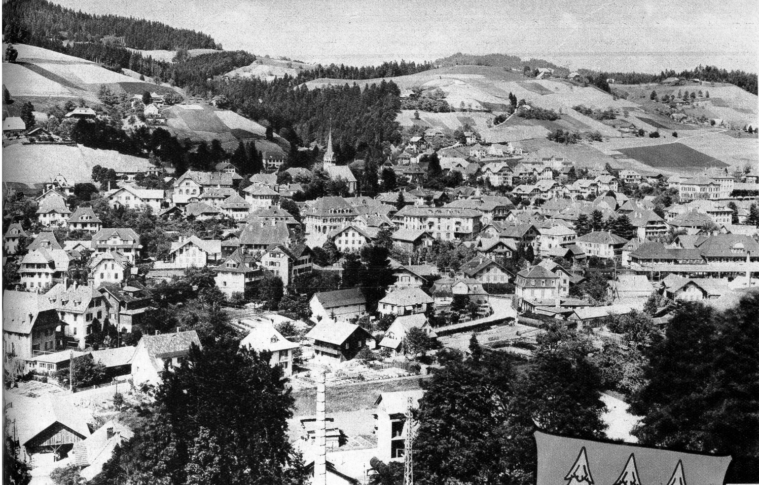
Gesamtansicht von Langnau. Im Hintergrund links ist der Berg, wo noch heute das Haus steht, in welchem Micheli Schüpbuch, der Wunderdoktor wirkte