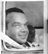
Caracciola, der bekannte Rennfahrer und Sieger früherer Rennen, der in Auserka einen schweren Unfall erlitt, liess zum Schluss die weisse Fahne.