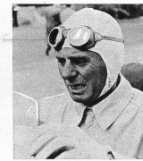
Achille Varzi der zweite im Endlauf um den Grossen Preis der Schweiz am Start