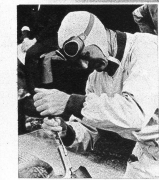
Chiron (Italien) fliekt an seiner Windschutzscheibe, die während des Rennens brach