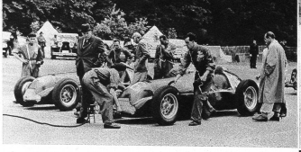
Mit einem elektrischen Anlasser wurden die Motoren der Kleinwagen in Gang gebracht.

Der Franzose Jean-Pierre Wimille sicherte den Sieg vor seinen Markennachbarn Varzi und Graf Trossel (beide Italiener). (ATP)