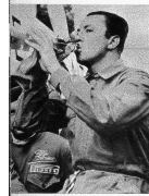
Der Sieger des Grossen Preises der Schweiz für Automobile Jean-Pierre Wimille lösch den ersten Pust nach dem Rennen