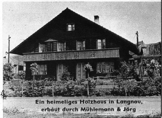
Ein heimeliges Holzhaus in Langnau, erbaut durch Mühle- mann & Jörg