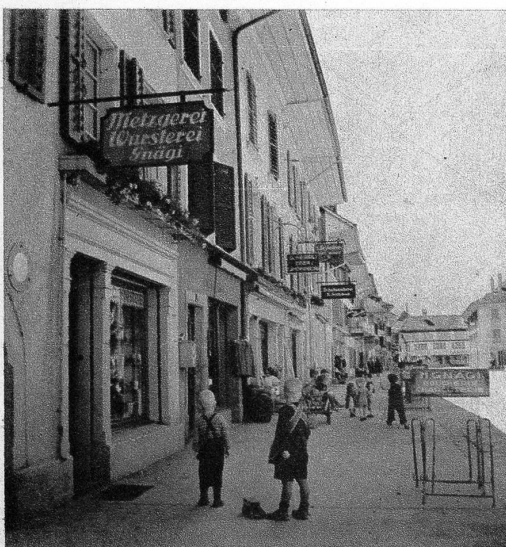
Partie im Städtchen