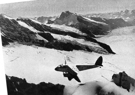
Blick auf den Aletschgletscher und die Sphinx (Vordergrund)

lassen und schmerzgerade auf den Wiesen himmelwärts. Längs hoch uns wieder der Thunersee entgegen, den wir während einer engen Kurve über dem Hiesendipfel als rötlichroter Kreiselung irgendwo in Nichte hängen sehen. — 11.25 Uhr — Nun befindet unsere treue Maschine an einem, liest sich wie ein Hieser durchs Überfliegen aus der tiefblauen Himmelskuppel, Stummel, Stockbrunn, Amoldingersee kommen und oben, in Westen grünet das Guggersbühl. Schon sehen wir vor uns die Bundesstadt, hoch gleich kurven wir ab und um 11.40 Uhr nimmt uns die Erde wieder in Empfang, machen wir uns ihre unbeschreibliche Jodelsprache, die sie schonbar nur uns Schweizern und Bernern in solch vernehmlicher Fille resorriert hat, in vollsten Sätzen gessenen dürfen. Pünktlich in diesen Alpenflug, Absteher in eine saubere Trauemetel, in die wir uns gerne noch dutzendmal, hundertmal entführen lassen möchten.