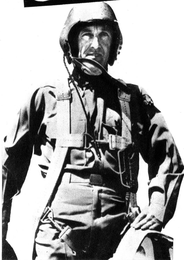
Der Schnellste Mann der Welt

Mit einem Lockheed-«Sternschnuppe»-Düsenflugzeug ist dem amerikanischen Militärflieger Colonel Albert Boyd gelungen, mit 623,8 Meilen pro Stunde (1033,9 km/Std.) einen neuen Weltgeschwindigkeitsrekord aufzustellen