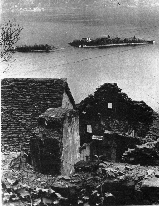
Unten auf den Inseln, die fantastischen Anlagen und die glänzende Villa des reichen Enden seelig. Hier oben die Ruinen von Fontana Martina

den Geissenpfad nach der Geister- und Reinenstadt Fontana Martina, die in den wilden Klüften nutzlos und fast unerreichbar am Berggang ein wenig hierher oberhalb Brissago ein seltsames Dasein fristet.