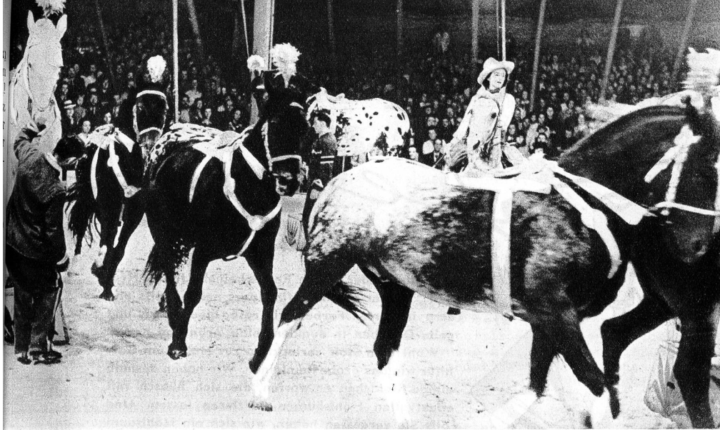
Oben: Eliane Knie in einer rassigen Cow-Girl-Nummer mit ihren unbändigen und doch so disziplinierten Rassepferden Rechts: Jeden Morgen wird auf dieser primitiven Einrichtung ein Balanceakt geübt, der in der Vorstellung auf blitzblanken Geräten in schwindelnder Höhe des Zirkuszelttes ausgeführt wird. Körperbeherrschung und Geistesgegenwart können auch mit diesen einfachen Mitteln geschult und auf die Probe gestellt werden