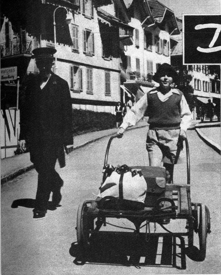
Der prinzliche Piccolo

Bekanntlich haben auch gekrönte Häupter meistens sehr ungewöhnliche Steckenpferde. Nun, der junge ägyptische Prinz Seni Toussoun, der zurzeit in Wengen in den Ferien weilt, hat sich für ein sehr demokratisches Steckenpferd entschieden: es ist vorderhand sein grösstes Vergnügen, dem Hotelportier das Gepäckzweirad an die Bahn schieben zu dürfen. Mit zunehmendem Alter wird er sich wohl ein standesgemässeres «hobby» suchen müssen