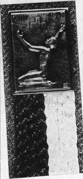
Die 1. August-Plakette 1947

Bekanntlich haben auch gekrönte Häupter meistens sehr ungewöhnliche Steckenpferde. Nun, der junge ägyptische Prinz Seni Toussoun, der zurzeit in Wengen in den Ferien weilt, hat sich für ein sehr demokratisches Steckenpferd entschieden: es ist vorderhand sein grösstes Vergnügen, dem Hotelportier das Gepäckzweirad an die Bahn schieben zu dürfen. Mit zunehmendem Alter wird er sich wohl ein standesgemässeres «hobby» suchen müssen