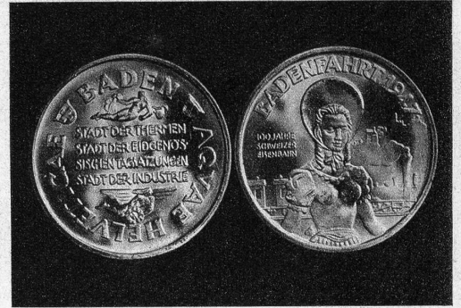
Gedenktaler zur Badenfahrt 1947

Die am 31. Juli und 1. August in den Strassenverkauf gelangende Bundesfeier-Plakette 1947 — ein Werk des vor kurzem verstorbenen Basler Medailleurs Hans Frei — ist aus Bronze und zeigt einen knienden Jüngling, die geöffneten Arme dem von einem Strahlenkranz umrahmten Schweizerkreuz entgegengestreckend. Die diesjährige Bundesfeier-Aktion ist zur Hilfe an die Gebrechlichen und Krebsgefährdeten bestimmt. (ATP)