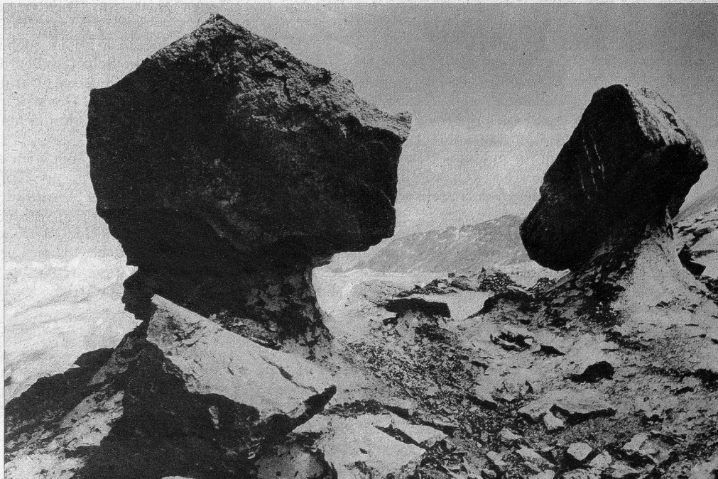
Zwei Gletscherpilze auf dem Aletschgletscher