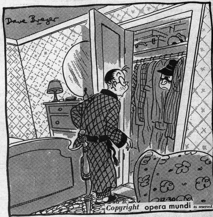
«Entschuldigen Sie, ich wusste nicht, dass jemand da drinnen ist»