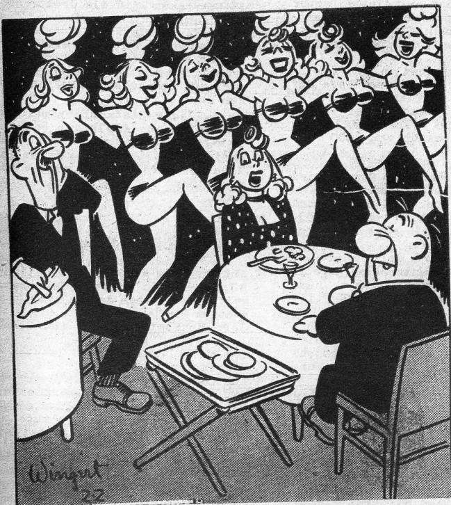
«Ich kann nicht verstehen, warum deine Geschäftsfreunde hier essen, die Speisen sind doch so schlecht zubereitet»