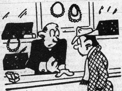
Links: «Gefällt denn der Ring Ihrem Fräulein Braut nicht?» «Oh doch – aber ich gefall' ihr nicht mehr...» (La Pese)