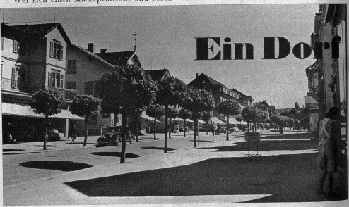
Die Hauptstrasse in Kreuzlingen, die zum Zell führt

K reuzlingen, das soeben zum Benjamin unter den Städten heranwuchs, verankert seine Gründung dem hl. Konrad I. der 943-975 Bischof von Konstanz war. Nach der Rückkehr von seiner Pilgerfahrt nach Jerusalem stiftete er im Jahre 988 in Stadelhofen, einem Vorort des damaligen Konstanz, ein Asyl für Arme, Kranke und Pilger und beschenkte dieses