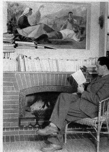
Wertvolle Originalgemälde schmücken das Bibliothekszimmer des 34jährigen Schriftstellers, der heute neben Ch. F. Ramuz zu den bekanntesten Erzählern der Westschweiz gehört

Wer den Boden des Wallis betritt, kommt in einen Kanton, der eine Eidgenossenschaft für sich bildet. Wohl hat er seit seinem Eintritt in den Bund, der im Sommer 1815 erfolgte, helvetische Züge angenommen. Aber wenige Gebiete der Schweiz wurden durch die Neuzeit so wenig abgeschliffen und schablonisiert wie das Wallis, von dessen Bodenfläche beinahe die Hälfte unfruchtbar ist. Das bedingt ein hartes, arbeitsames Leben, eine herbe Rasse, die nicht nur den feurigen Fendant trinkt, sondern auch trockenes, monatealtes Brot und selbstgemachten Käse isst. Es ist überhaupt ein Land ungeheurer Gegensätze. In der Höhe die buckligen Gletscher, die wie Schildkröten in der Einsamkeit brüten, in der Tiefe die junge Rhone, die wie ein junger, feurriger Stier in die Arme des Genfersees galop-