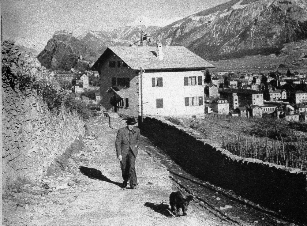
In Sitten, der Hauptstadt des Wallis, lebt der Dichter, der heute als der literarische Repräsentant seiner schönen Heimat gilt. — Das Haus im Vordergrund ist sein Heim