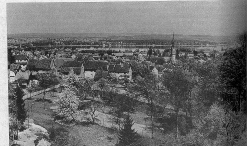
Blick vom Viadukt auf Kreuzlingen

Haus mit einem von ihm aus Jerusalem mitgebrachten Splitter des hl. Kreuzes. Daraus erhielt das Hospiz den Namen Crucellin (woraus Kreuzlingen entstand). Kreuzlingen, das bildende Dorf am linken Ufer der Bucht von Konstanz, mit dem es durch eine ununterbrochene Häuserreihe verbunden ist, hat soeben seinen 10 000 Einwohner erhalten und ist damit zur Stadt avanciert.