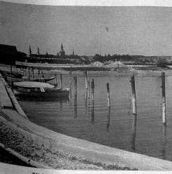
Blick vom Hafen Kreuzlingen auf Konstanz