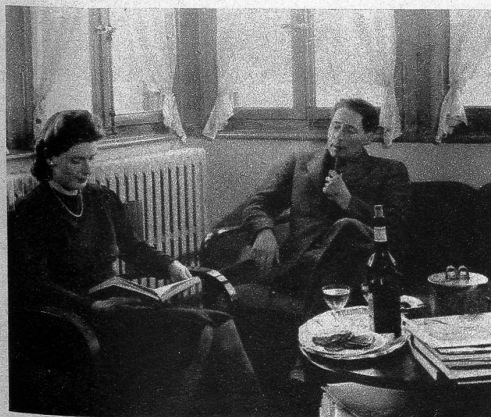
Nach der Arbeit ist gut ruhen! Die Lese-Ecke, in der wir den Dichter und seine Frau bei einem Glase guten Fendants antreffen