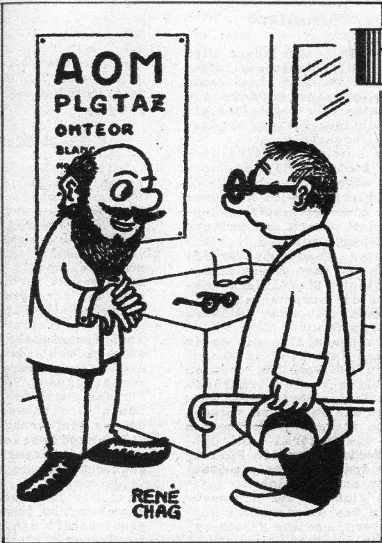
Beim Optiker. «Ich hoffe, Sie sehen jetzt tadellos!» «Tadellos, Madame!»