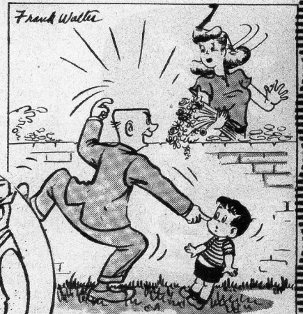
«Ihr Sohn da - nannte mich einen Flachschädel!»