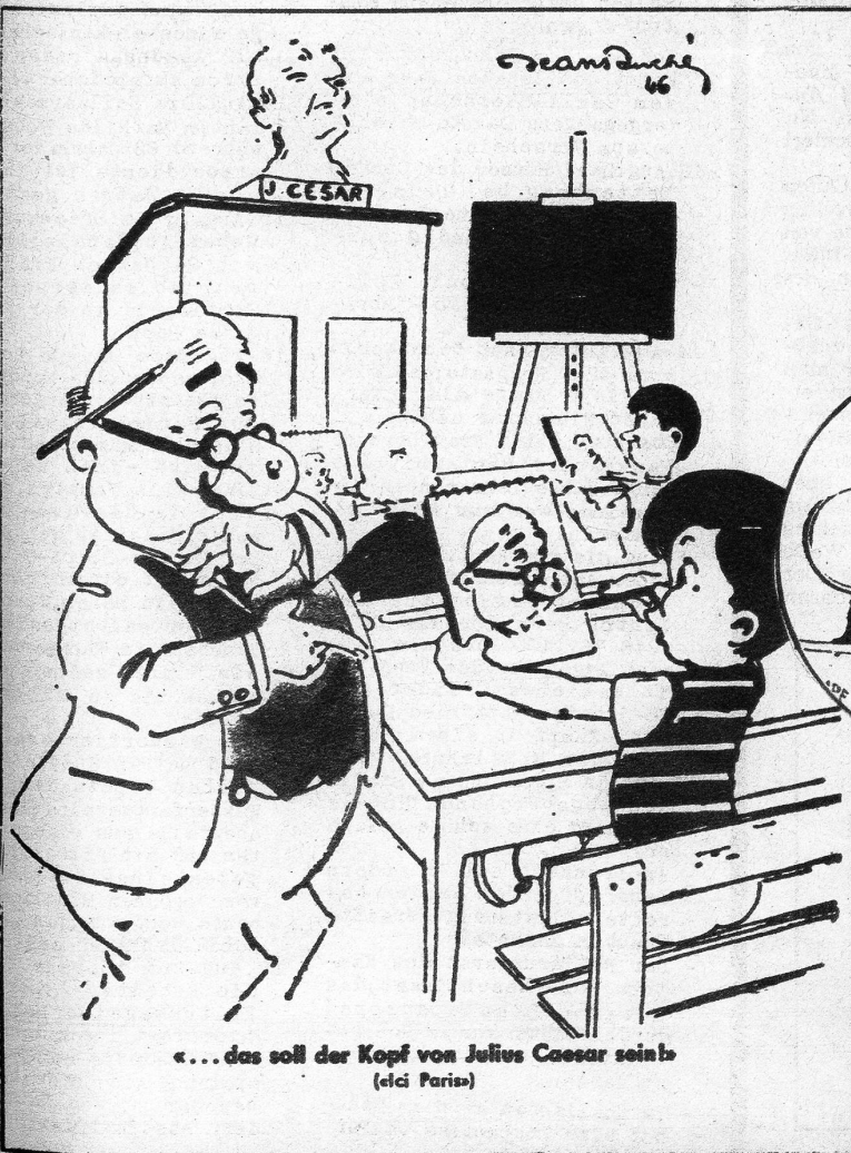
«... das soll der Kopf von Julius Caesar sein» (ici Paris)