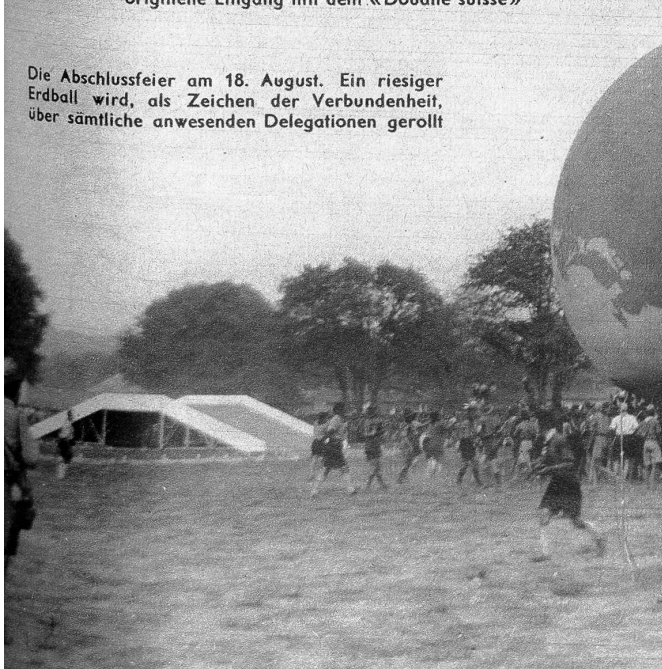
Die Abschlussfeier am 18. August. Ein riesiger Erdball wird, als Zeichen der Verbundenheit, über sämtliche anwesenden Delegationen gerollt