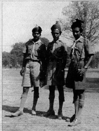
Drei Pfader der indischen Delegation. Alle Klassenunterschiede sind verschwunden

Amitié des Jeunes - Paix des Hommes! ME II