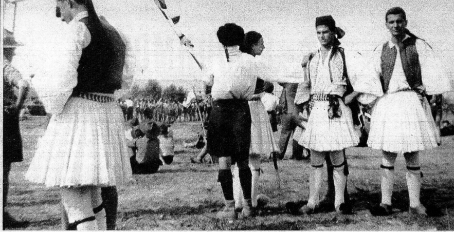
Griechen auf dem Lagerplatz in Moisson