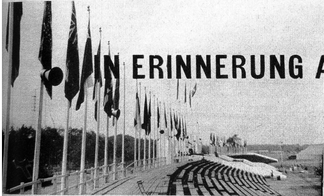
Die Tribüne, geschmückt mit den Landesfarben aller anwesenden Nationen