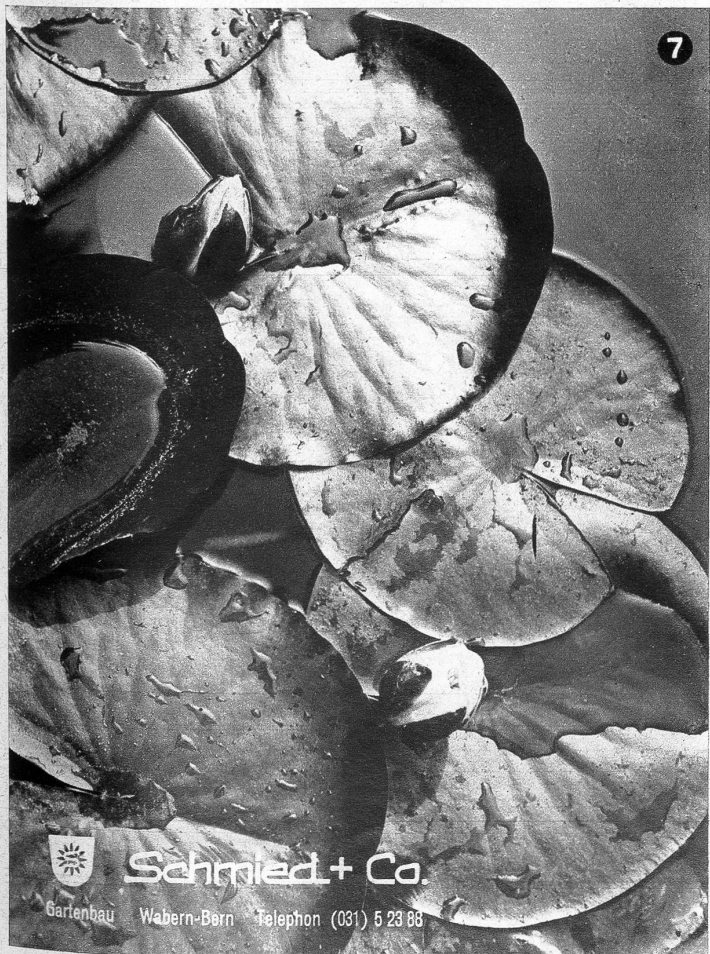
FOTO-KUNST IM DIENST DER WERBUN