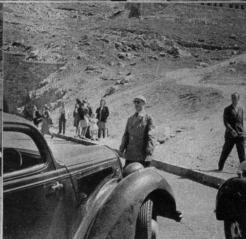
Ein Funktionär des TCS leitet den Parkdienst auf der Passhöhe — Oberes Bild: Der Patrouillenfahrer des TCS leistet einem von einer Panne betroffenen Automobilisten die erste Hilfe