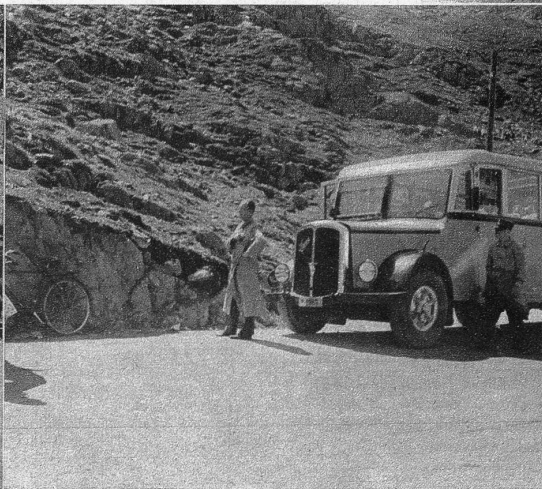
Auch die Post parkiert manchmal ihre Wagen sehr unzweckmässig, wie die Aufstellung dieses Wagens auf der Passhöhe beweist