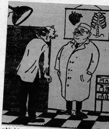
«Nichts zu machen! Sie sind so krank, dass Ihnen Gesundheit nichts nützen würde.» (il 420)