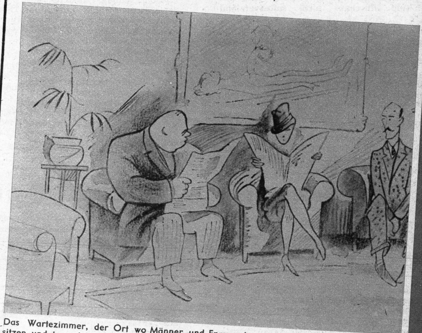
Das Wartezimmer, der Ort wo Männer und Frauen in gezwungenen Stellungen umher-sitzen und tun, als ob sie in Zeitschriften lesen würden—immer für den Unbeteiligten ein komischer Anblick. (Lustige Blätter)