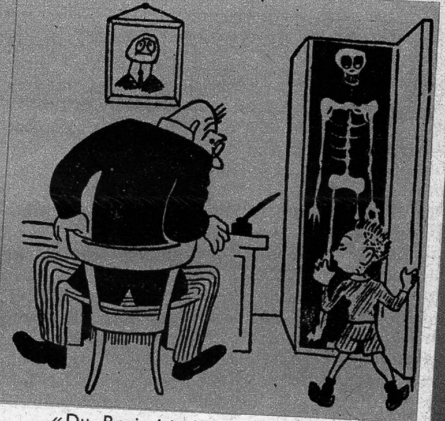
«Du Papi, ist das dein erster Patient?» (Politiken)