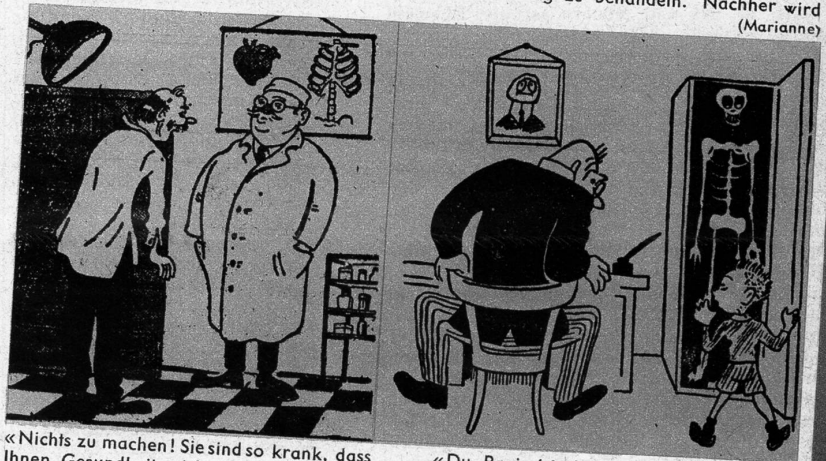
«Nichts zu machen! Sie sind so krank, dass Ihnen Gesundheit nichts nützen würde.» (il 420)