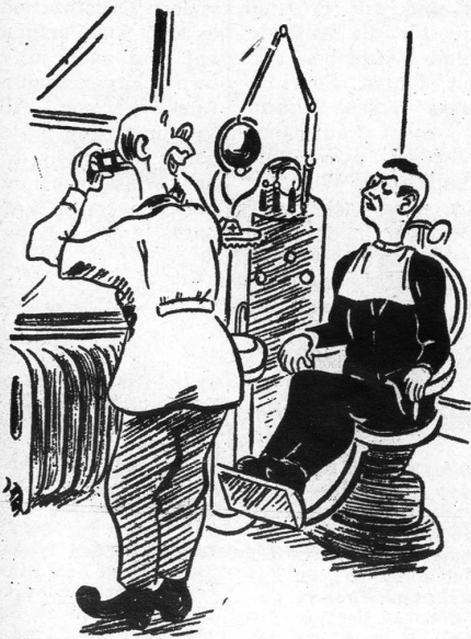
«Ihr Röntgenbild sagt mir, dass ich mir bald einen neuen Wagen kaufen kann» (College Humor)