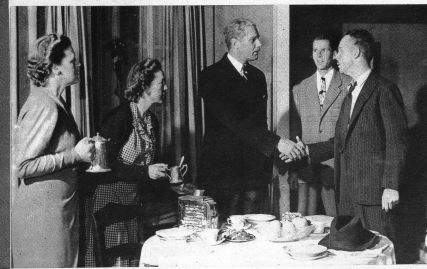
Der Direktor und der Gewerkschaftssekretär finden sich und beschliessen, zusammen das zu tun «was recht ist» und nicht mehr darum zu kämpfen «wer recht hat».