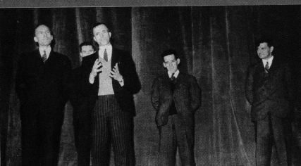
Unter dem Patronat eines schweizerischen Einladungskomitees wurde am Berner Stadttheater von Mitgliedern des Lagers für «Moralische Wiederaufrüstung» das in englischsprachigen Ländern mit grossem Erfolg aufgenommene Industriedrama «The Forgotten Factors» («Der vergessene Faktor») zur Erntauf-führung gebracht. Die Aufführung fand vor Parlamentariern, vor Vertretern der Regierung, der Armee und des diplomatischen Corps statt und hinterliess einen nachhaltigen Eindruck. Das Bild: Kohlengrubenarbeiter, Sekretäre der englischen Bergleitetgewerkschaft, legen vor der Aufführung von der Bühne aus Zeugnis ab von der erstaunlichen Wirkung, die die Aufführung dieses Stückes vor ihren Gewerkschaften in der Schaffung industrieller Zusammenarbeit und in der Beilegung von Arbeitskonflikten erzielte. Unser Bild zeigt (2. von links) den Gewerkschaftssekretär der britischen Kohlengruben, Bill Yates, rechts daneben Jack Ashley und Bill Wilde, beide von North Staffs