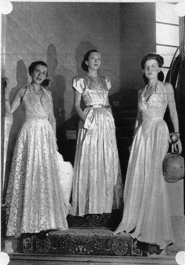
Von links nach rechts: Hellblaues Chantilly-Spitzenkleid — goldfarbenedes Brokatkleid — weisses, sehr reich gearbeitetes Lamékleid

Die Variation in den Wollkleidern war so reichhaltig und begeisternd,