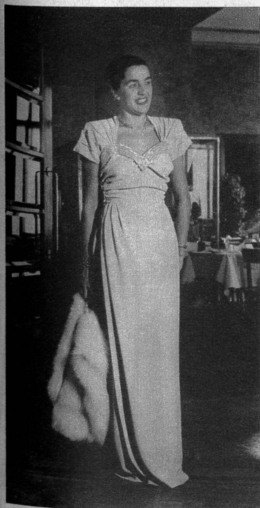
Silbergraues Dinerkleid mit gleichfarbigem Stiftpferlen

Daneben haben aber wundervolle Seidenkleider gemustert und uni durch ihre raffinierte Einfachheit besonders gefallen. Mit einem einfachen goldenen Gürtel, einem Streifen Pailletten verziert oder aus reichem Damast in Tailienform gearbeitet, brachten sie die zahlreichen Zuschauer zur Begeisterung. Den Clou der Modeschau bildeten die Abendkleider, die aus lange vermissten, wunderschönen Stoffen gearbeitet waren. Brokat und Damast, Spitzen und weiche Satins schufen die Grundlage für die zahlreichen Diner- und Abendkleider, die in ihrer Materialfülle zum Schönsten gehören, was man in der Modeindustrie gesehen hat. Ueberhaupt durfte man wohl als das Positive der diesjährigen Modeschau mit nach Hause nehmen, dass die einzelnen Modelle wieder aus ganz wundervollem Material hergestellt sind, die an die besten Vorkriegsjahre erinnern und sie zum Teil noch überbieten. Das Ganze ist das Resultat langer, geschulter und sachkundiger Vorarbeit, gepaart mit dem sicheren Talent der guten Auswahl. Es war ein wirklicher Erfolg.