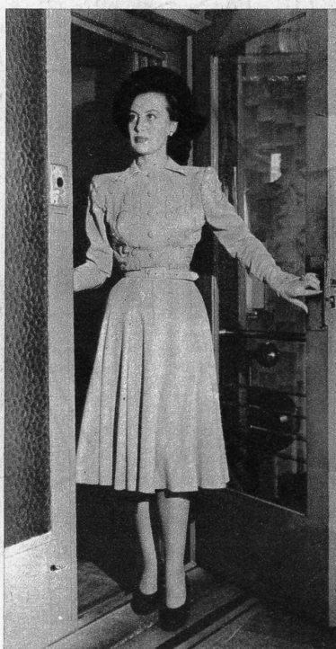
Lindensfarbenedes Wollkleid mit sehr weitem Jupe. Oberteil reich bestickt