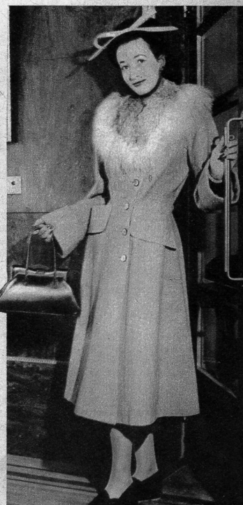
Direkt aus England kommt dieser sehr modische Sportmantel. Neu sind die betonten Hüfte