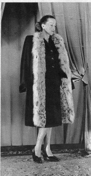
Dunkelgrünes Ensemble mit breiter Luchs-verzierung für die elegante Dame