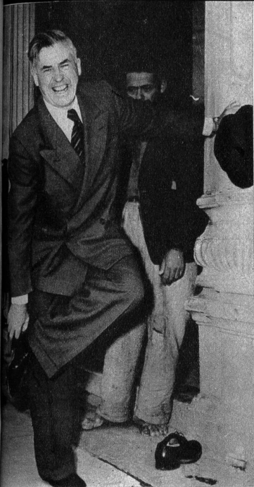
Henri Wallace — bitte Schuhe ausziehen

Wer eine Moschee betritt, hat sich seiner Schuhe zu entledigen! So schreiben es die «einschlägigen» Vorschriften vor und hat es auch der frühere Vizepräsident der Vereinigten Staaten von Amerika, Henri Wallace, zu tun, wenn er auf seiner Journalistenreise durch Palästina eine Jerusalemer Moschee besichtigen will.