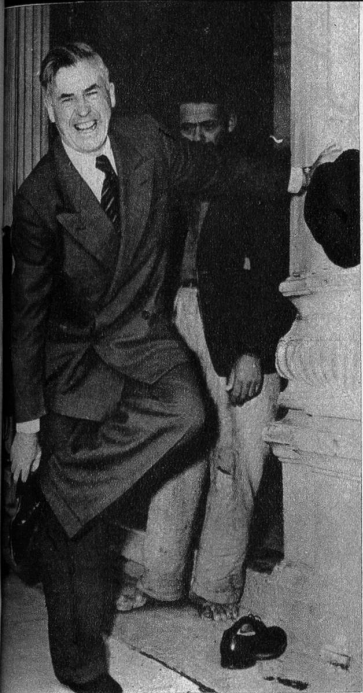
Henri Wallace — bitte Schuhe ausziehen

Wer eine Moschee betritt, hat sich seiner Schuhe zu entledigen! So schreiben es die «einschlägigen» Vorschriften vor und hat es auch der frühere Vizepräsident der Vereinigten Staaten von Amerika, Henri Wallace, zu tun, wenn er auf seiner Journalistenreise durch Palästina eine Jerusalemer Moschee besichtigen will.