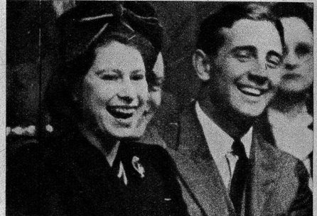
Am 22. April 1946 besuchte Prinzessin Elisabeth zum ersten Male inoffiziell eine Vorstellung im Zirkus Bertram Mills. Wir sehen sie hier in Begleitung eines hohen Offiziers in Zivil