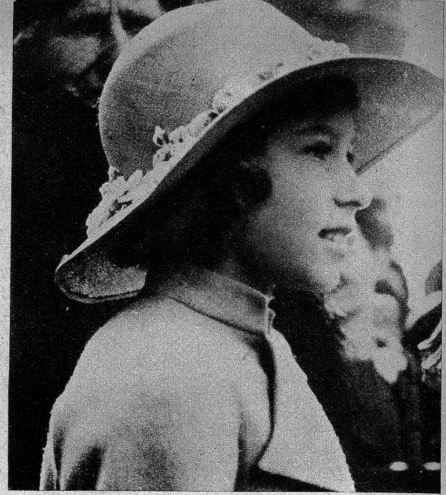
Prinzessin Elisabeth im Alter von 9 Jahren

Stockwerke ausfüllt, wurde erst in den letzten Jahrzehnten prächtiger gestaltet, und nach Ende des letztverflossenen Krieges erst konnten die Bombenschäden gutgemacht werden, die der Palast im zweiten Kriegsjahre erlitten hatte. Vor dem Palast erhebt sich das eindrucksvoll dimensionierte Denkmal der Königin Victoria, das den Abschluss einer über anderthalb Kilometer langen Avenue bildet, die schnurgerade vom Zentrum der Hauptstadt (Trafalgar Square) zum Palast führt, und die einen Teil der Route bildet, über welche sich der hochzeitliche Festzug bewegen wird.