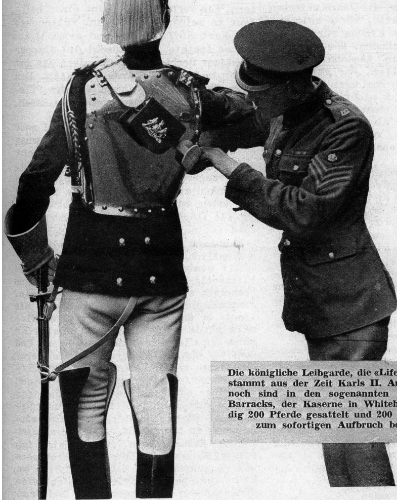
Die königliche Leibgarde, die «Life Guards», stammt aus der Zeit Karls II. Auch heute noch sind in den sogenannten Whitehall Barracks, der Kaserne in Whitehall, ständig 200 Pferde gesattelt und 200 Gardisten zum sofortigen Aufbruch bereit