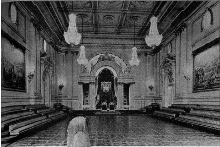
Der Ballsaal im Buckingham-Palast. Im Hintergrund die Thronsessel des Königspaares