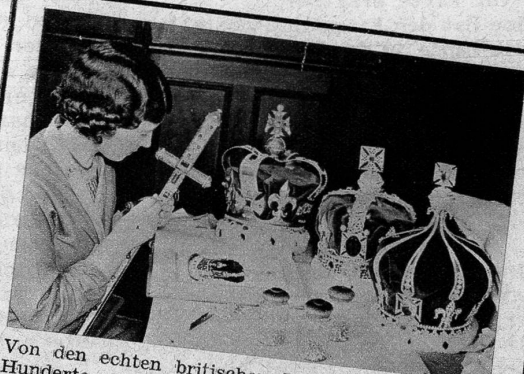
Von den echten britischen Kronjuwelen gibt es Hunderte von Nachahmungen, die eine Londoner Spezialfirma herstellt. Die Nachbildungen sind absolut originalgetreu ausgeführt. Der komplette Satz dieser glitzernden und funkelnden Imitationen umfasst fünf Kronen (die Krone von England, die Krone Prinz von Wales, die Königin Mary-Krone, die Staatskrone und die Kaiserkrone von Indien), fünf Schwerter, sechs Zepter und Reichäpfel, ferner verschiedene berühmte Orden, wie Hosenbandorden, Bath Orden usw.

wäre, in den 900 Jahre alten Tower von London — die älteste, ständig besetzte Festung Europas — zurückgebracht. Keiner der Beamten, die mit der Aufbewahrung der Juwelen betraut sind, wollte über die gegen Diebstahl und Feuer getroffenen Massnahmen Auskunft geben, doch weiss man, dass nur die allermodernsten Methoden angewandt werden.