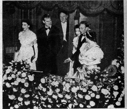
Die englische Königsfamilie im Londoner Palladium-Variété. Wenn sich die englische Königsfamilie zu einem Variétébesuch entschliesst, dann ist das für den Theaterdirektor wie für die Künstler die höchste Ehrung, die man sich denken kann

Prinzessin Elisabeth Alexandra Mary, die erstgeborene Tochter (21. April 1926) des englischen Königspaares, die Anwärterin auf den englischen Königsthron, die am 20. November Prinz Leutnant Philip Mountbatten heiratet wird. — Neben ihr Prinzessin Margaret Rose