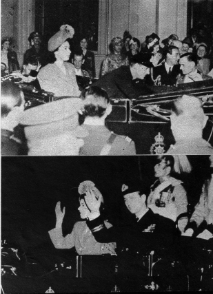
Das Paar auf der Fahrt nach der Waterloo-Station, wo die beiden einen Sonderzug bestiegen.

Als nach den Hochzeitsfeierlichkeiten im Buckingham-Palast die Neuvermählten den Wagen bestiegen wollten, — die Kronprinzessin hat ihr Brautkleid mit einem blauen Reisekostüm vertauscht — der sie nach dem Waterloo-Bahnhof und von dort auf die Besatzung der Mountbattens in Broadlands führen sollte, setzte auf das abgungelose Paar ein wahres Bombardement mit Rosenblättern ein, woran Könige und Königinnen und Prinzen beteiligt waren