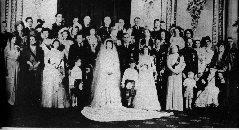
Die offizielle Vermählungsphoto mit den 27 regierenden Königen und Fürsten Europas. An dem mit ausserordentlichem Aufwand von Pomp und Prunk begangenen Hochzeitsfeste im englischen Königshaus nahmen sämtliche regierenden Könige und Fürsten Europas teil. Unser Bild zeigt: 1. Reihe (v. l. n. r.): unbekannt, Prinzessin André von Griechenland (Mutter des Bräutigams), Prinzessin Margreth, Trauzuge Marquis of Milford Haven, Fage Prinz William von Gloucester, die Braut, Bräutigam, Fage Prinz Michael of Kent, Prinzessin Alexandra von Kent, der König George, Königin Elisabeth, Herzog von Gloucester, vor ihm sein Sohn Richard, Mutter der Königin Elisabeth. 2. Reihe (v. l. n. r.): dritte (in weiss) Countess Mountbatten, Herzogin von Kent, Kronprinzessin Juliana, Königin Frederik von Griechenland, Königin Mary, Edkönigin Ema von Spanien, Königin Ingrid von Dänemark, Kronprinzessin von Schweden, Herzogin von Aosta, neben dem Herzog von Gloucester die Herzogin von Gloucester, ganz aussen Königin von Norwegen und Kronprinz von Schweden. 3. Reihe (v. l. n. r.): Peter von Jugoslawien, Earl Mountbatten, Prinz Bernhard der Niederlande, König Haakon von Norwegen, Prinz George von Griechenland, zweitnächster König Frederik von Dänemark, König Michael von Rumänien.