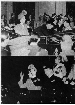
Das Paar auf der Fahrt nach der Waterloo-Station, wo die beiden einen Sonderzug bestiegen.

Als nach den Hochzeitsfeierlichkeiten im Buckingham-Palast die Neuvermählten den Wagen bestiegen wollten, — die Kronprinzessin hat ihr Brautkleid mit einem blauen Reisekostüm vertauscht — der sie nach dem Waterloo-Bahnhof und von dort auf die Besatzung der Mountbattens in Broadlands führen sollte, setzte auf das ahnungslose Paar ein wahres Bombardement mit Rosenblättern ein, woran Könige und Königinnen und Prinzen beteiligt waren.