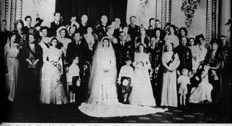
Die offizielle Vermählungsphoto mit den 27 regierenden Königen und Fürsten Europas. An dem mit ausserordentlichem Aufwand von Pomp und Prunk begangenen Hochzeitsfeste im englischen Königshaus nahmen sämtliche regierenden Könige und Fürsten Europas teil. Unser Bild zeigt: 1. Reihe (v. l. n. r.): unbekannt, Prinzessin André von Griechenland (Mutter des Brautgämers), Prinzessin Margreth, Trauzuge Marquis of Melford Haven, Fage Prinz William von Gloucester, die Braut, Brautgänger, Fage Prinz Michael of Kent, Prinzessin Alexandra von Kent, der König George, Königin Elisabeth, Herzog von Gloucester, vor ihm sein Sohn Richard, Mutter der Königin Elisabeth. 2. Reihe (v. l. n. r.): dritte (in weiss) Countess Mountbatten, Herzogin von Kent, Kronprinzessin Juliana, Königin Frederik von Griechenland, Königin Mary, Edkönigin Ema von Spanien, Königin Ingrid von Dänemark, Kronprinzessin von Schweden, Herzogin von Aosta, neben dem Herzog von Gloucester die Herzogin von Gloucester, ganz aussen Königin von Norwegen und Kronprinz von Schweden. 3. Reihe (v. l. n. r.): Peter von Jugoslawien, Earl Mountbatten, Prinz Bernhard der Niederlande, König Haakon von Norwegen, Prinz George von Griechenland, zweitnächster König Frederik von Dänemark, König Michael von Rumänien