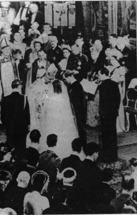
Der feierliche Moment in der Westminsterabtei verlässt der Brautgänger die mit Gästen angefüllte Kirche. An der Spitze erkennt man das Brautpaar, gefolgt von den acht Brautjungfern.