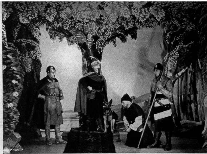
Akt I: Gerichtsverhandlung