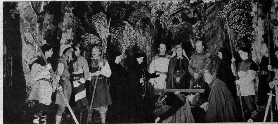
Der Sieg der Bauern