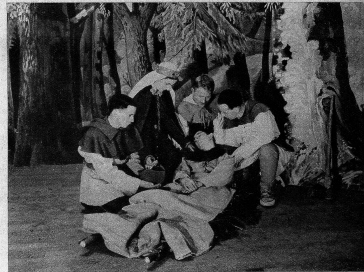
Akt III: Die Rodung verlangt ihre Opfer