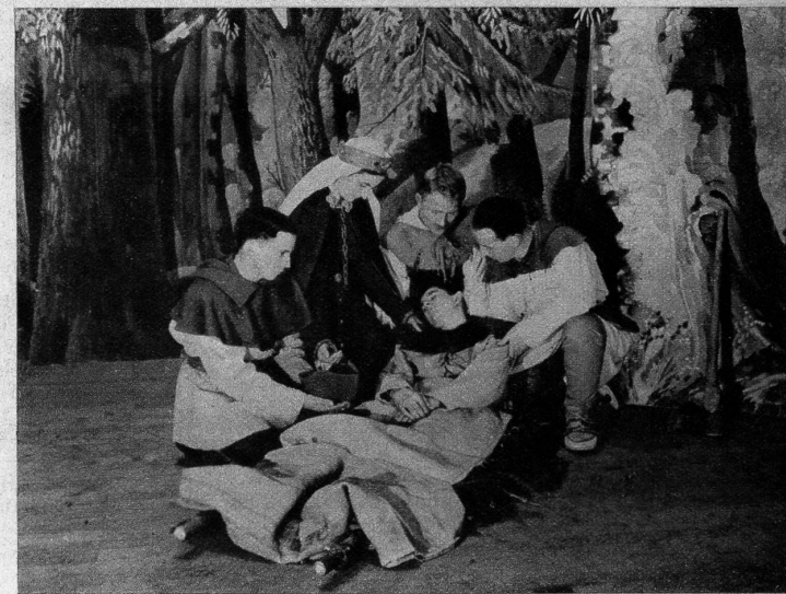
Akt III: Die Rodung verlangt ihre Opfer