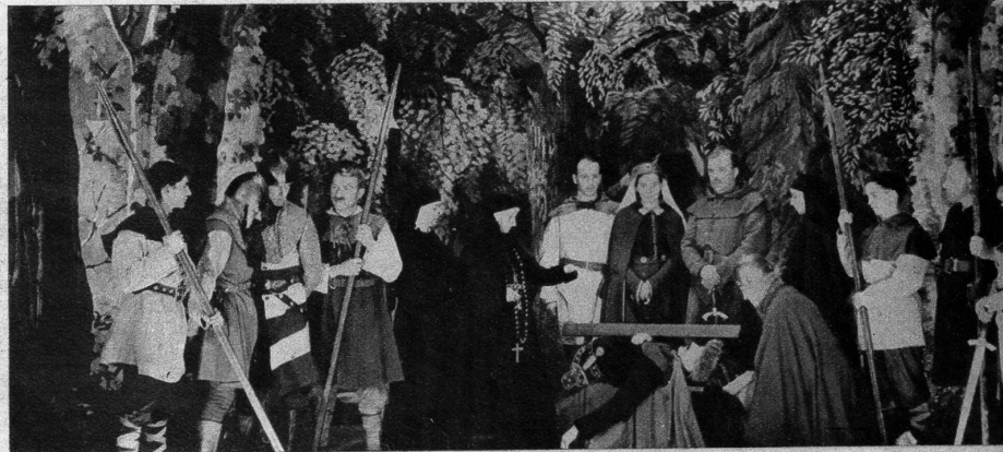
Der Sieg der Bauern