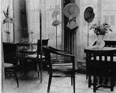
Wie zu einer Tea-Party ladet dieser Verkaufsraum bei H. Ehrensberger, Modes, im Hause Ciolina, Marktgasse 51, ein. Da und dort locken Hutständer mit fröhlichen, kecken, diskreten, klassischen, sportlichen Modellen, an denen kundige Blicke haften bleiben.