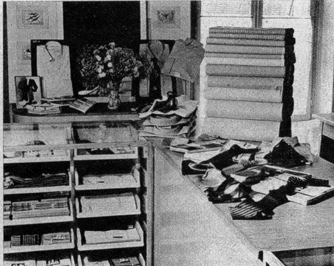
Etagengeschäfte sind vielfach zugleich Fabrikationsgeschäfte. Auch Herr Willy Müller, Waisenhausplatz 21, kauft selbst ein, leitet das Atelier, steht in persönlicher Verbindung mit der Kundschaft. Unschätzbare Vorteile des guten Etagengeschäfts.