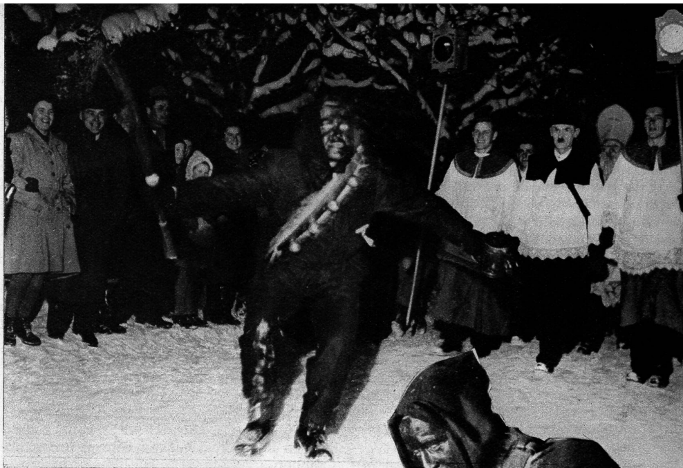
Der Samichlaus zieht durch das Dorf. Ihm voraus eilt der Schwarze «Schmutzli», der Platz macht und mit seiner Rute da und dort ein bisschen droht. Grosses Geschrei und frohes Lachen ertönt, wenn eine Dorfschöne von ihm ein richtiges «Brämi» (Schwärzen mit Russ) erhält Rechts: Der «Schmutzli» nimmt einen unfolgsamen Buben in die Kur