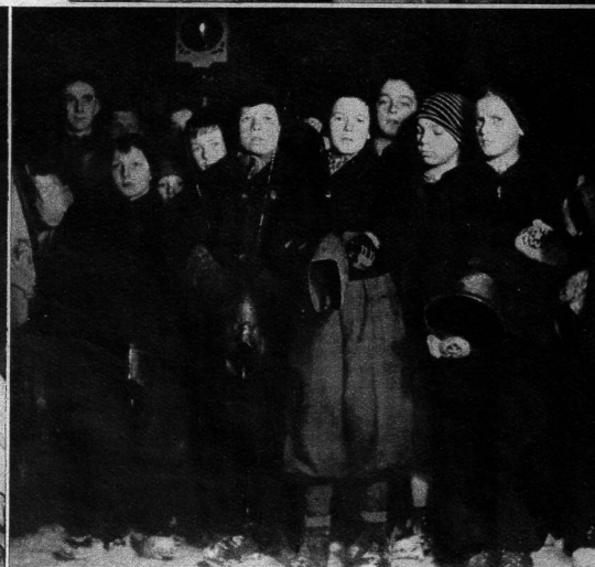
Mit Ungeduld erwarten die «Treichler» oder «Chlöpfer» den Samichlaus. Ihre Glocken im Takt schwingend, begleiten sie den Chlauszug