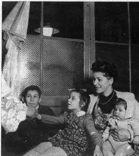
Etwas ängstlich hören die Kinder dem Samichlaus zu und versprechen im kommenden Jahr gut zu folgen und fleissig zu lernen

Die Krienser Bevölkerung fühlt sich von jeher dem St. Nikolaus besonders zugetan, denn er ist ihr Schutzpatron gegen Wassernot, unter welcher der Ort in alter Zeit viel zu leiden hatte. So gibt es in Kriens eine besondere Zunft, die dafür zu sorgen hat, dass der St. Niklaustag würdig gefeiert wird. Den Höhepunkt bildet natürlich auch hier die Besenkung der Kinder und an einem Festumzug kann die gesamte Bevölkerung des Dorfes teilnehmen. Eine besondere Eigenart des St. Niklaustages in Kriens sind die «Chlöpfer». Betritt der Samichlaus ein Haus, so wird «zueklöpft» und verlässt er es wieder, so wird im Takt «Ewäg geklopft».