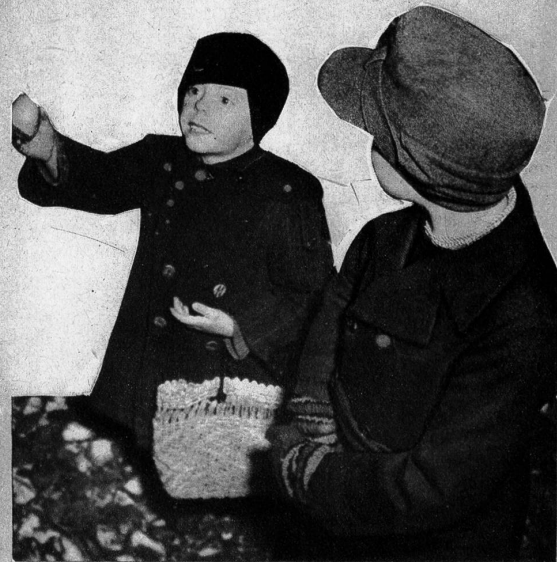
Junge Zwiebelverkäufer auf einem Bahnhof in Deutschland

Armbanduhren sind von allen Russen ganz besonders begehrt, sie tragen am liebsten gleich mehrere am gleichen Arm. Die Tochter meines Uhrmachers, noch ganz zittrig und bleich vom kaum überstandenen Schreck, erzählte: im Geschäft ihres Vaters erschien ein russischer Oberleutnant und übergab ihrem Vater einen mittelgrossen Regulator mit dem drohenden Befehl, ihm daraus mindestens fünf Armbanduhren sofort zu machen. Dass dergleichen völlig unmöglich, habe er einfach nicht glauben wollen und ihrem alten Vater mit der Pistole geschlagen und in der Raserei fast erschossen.