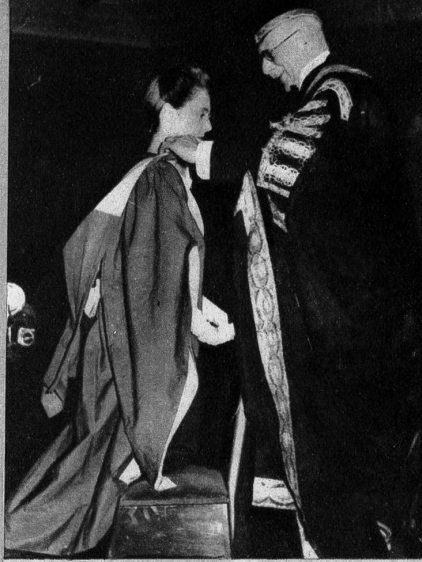
Es mag auch in den akademischen Kreisen Englands einiges Aufsehen erregt haben, dass eine Tänzerin den Ehrendoktor der berühmten Londoner Universität erhalten hat. In der Robe, die ihr glänzend steht, kniet die Ballettmeisterin des Balletts von Sadlers Wells in London, Ninette de Valois oder mit ihrem bürgerlichen Namen Mistress Edris Connell vor dem Kanzler der Universität, dem Earl of Athlone, um den Titel eines Doktors der Musik ehrenhalber zu empfangen

Eine imposante Rutschbahn bildet dieser Kanal aus Spezialstoff, wie er neuerdings von den amerikanischen Stadtfeuerwehren bei Notevakuationen zur Verwendung kommt. Wir sehen auf diesem Bilde während einer Demonstrationsübung die «Rettung» eines Mannes aus dem 6. Stockwerk.