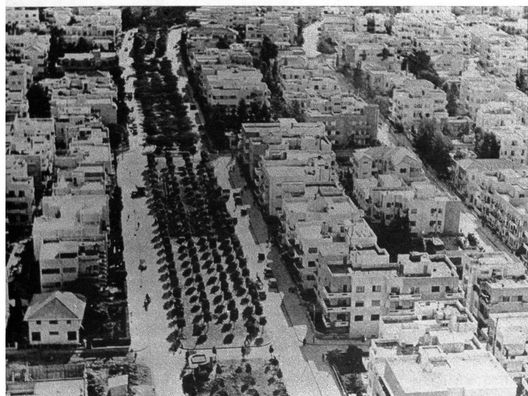
Tel Aviv, die Stadt des Frühlings, ein Sammelsurium von Kubismus und Futurismus, die Welthauptstadt des Judentums. In New York allein leben mehr Juden als in Palästina, trotzdem schaut das Judentum nach Tel Aviv als Hauptstadt «der Bewegung»

flussgebiet — man denke an den Irak, Transjordanien und Palästina —, ist durch die Schwächung Englands, dem Einfluss der Krone entglitten und mehr oder weniger unter den sternengeschmückten Hut Onkel Sams geraten. Ibn Saud, der Herr über 15 000 000 Mohammedaner in Saudi-Arabien, zog die amerikanischen Oelmänner den britischen vor, schon aus