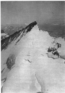
Nordend von der Dufourspitze aus gesehen

Im Jahre 1928 überschritt ich zum erstenmale die Dufourspitze in Begleitung von zwei Bergfreunden von Süden nach Norden. An einem selten klaren Augusttag waren wir über den wild zerissenem Grenzspitze zur Capanna Margherita aufgestiegen. Ein bitter kalter Nordsturm empfing uns und bannte eine bunte, international zusammengewürfelte Schar von Bergsteigern in das geräumige, aber wenig gemütliche Schutzhäus. Anderntags