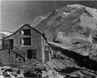
Belemphütte und Lyskamm